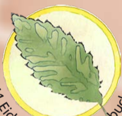
11 Eichenblättrige Hainbuche