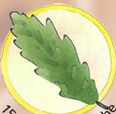
15 Immergrüne Eiche