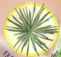
13 Blaue Atlas-Zeder