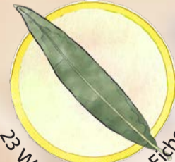
23 Weidenblättrige Eiche