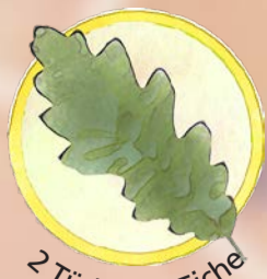
2 Türkische Eiche