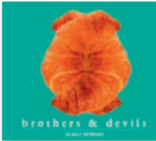
The Great Bertholinis: brothers & devils . 13,99 Euro, erhältlich unter www.originalproduct.de , bei Amazon und iTunes