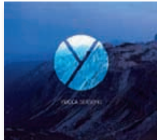
Yucca: Seasons . 12 Euro, erhältlich unter www.adp.bigcartel.com , bei Amazon und iTunes