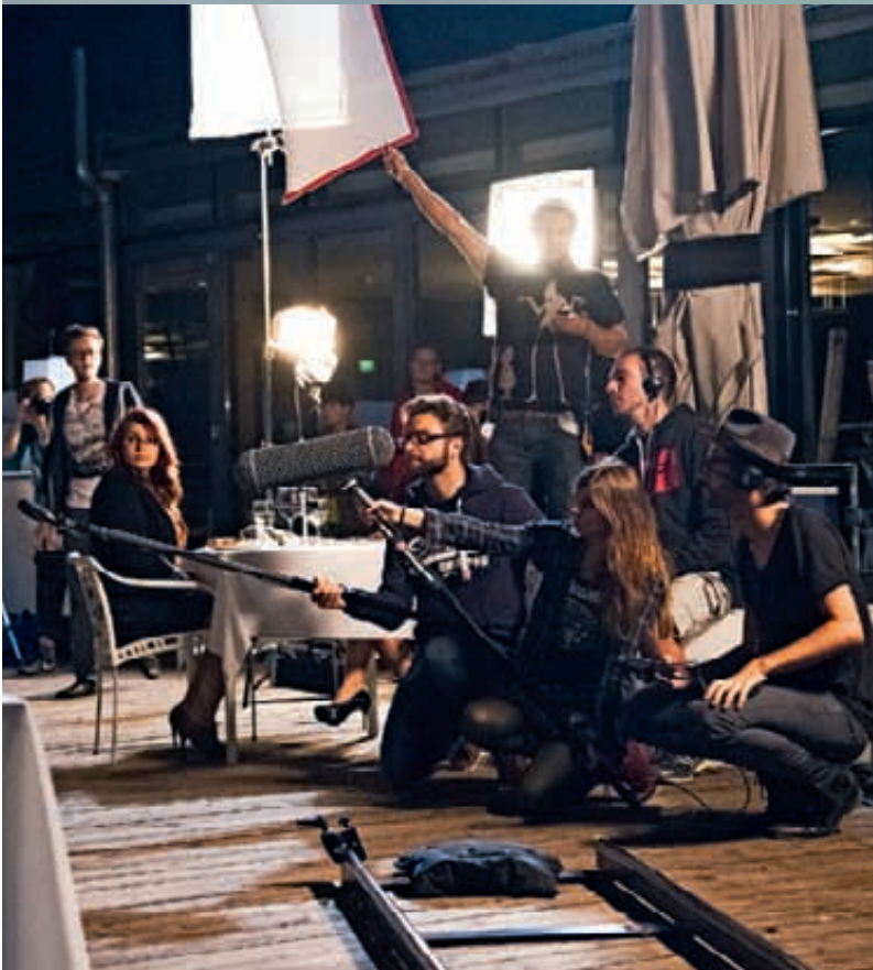
Im Sommer 2014 drehen fünf Studierende ihren Kurzfilm „11 Years“ auf der Dachterrasse der Bar b 2 in der Bartholomäusstraße.