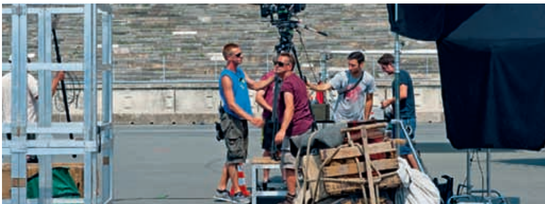
Bei Aufnahmen im Sommer 2013 vor der Zeppelintribüne gehört Flüchtlingsgepäck zur Ausstattung des Films „Landauer“, der ins Jahr 1947 zurückführt.