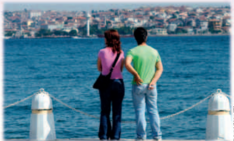
Istanbul: Die Türkei ist ein EU-Beitrittskandidat.

Neben diesen drei Beitrittskandidaten gibt es weitere vier potenzielle Kandidaten unter den westlichen Balkanländern, nämlich Albanien, Bosnien und Herzegowina, Montenegro und Serbien. Bereits jetzt räumt die EU allen Staaten des westlichen Balkans für die meisten Exporte freien Zugang zum EU-Markt ein, und sie unterstützt ihre internen Reformprogramme.