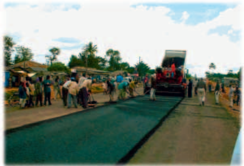
Allwetterstraßen sind für die Entwicklung Afrikas unverzichtbar.

Die besonderen Handels- und Hilfebeziehungen zwischen der EU und den 79 AKP-Staaten wurden durch das Abkommen von Lomé im Jahr 1975 eingeleitet. Diese Beziehungen werden durch die so genannten „Wirtschaftspartnerschaftsabkommen“ (WPA) weiter vertieft. Damit werden Handel und Hilfe der EU auf eine neuartige Weise kombiniert. Die AKP-Staaten werden ermutigt, die wirtschaftliche Integration mit ihren Nachbarn in der Region als Schritt hin zu ihrer Integration auf globaler Ebene zu pflegen, während die Hilfe stärker auf die Förderung des Aufbaus der Institutionen und einer verantwortungsvollen Staatsführung konzentriert wird. Im Rahmen der WPA wird die Entwicklungsdimension zum Eckpfeiler der EU-AKP-Partnerschaft.