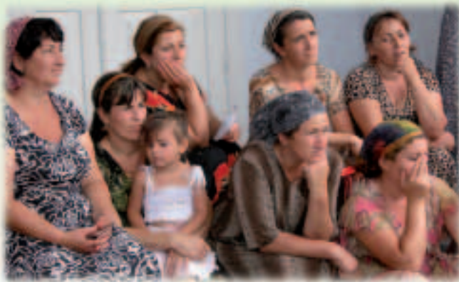
Tschetschenische Frauen informieren sich über Selbsthilfeprojekte.

Zwar hat sich die Lage etwas verbessert, so dass ECHO sein Programm zum ersten Mal seit 1999 etwas reduzieren konnte, aber nach wie vor sind viele Menschen auf finanzielle Unterstützung durch Organisationen wie Rotes Kreuz, UNHCR und Welternährungsprogramm angewiesen. Die EU finanziert im Rahmen ihres Hilfsprogramms für Tschetschenien Ausbildungsmaßnahmen für hilfsbedürftige Menschen vor Ort mit dem Ziel, sie in die Lage zu versetzen, selbst für sich zu sorgen. Dazu gehören einkommenschaffende Tätigkeiten wie Errichtung und Betrieb von Gewächshäusern.