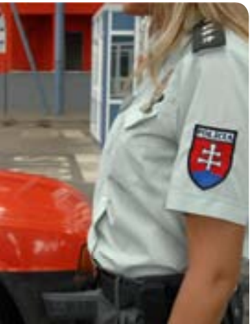
Slowakische Grenzbeamtin kontrolliert an der slowakisch-ukrainischen Grenze