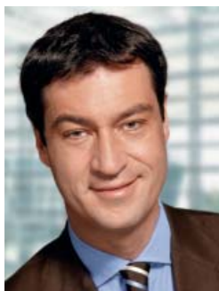
Dr. Markus Söder MdL Bayerischer Staatsminister für Umwelt und Gesundheit

Unser Anliegen ist Ihre Gesundheit! Schützen Sie sich und bleiben Sie gesund!