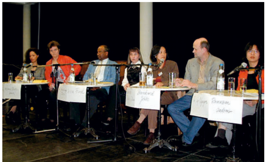
Nürnberger Migrantinnen und Migranten beim Gespräch über Identitätsfragen (rechts).