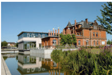
Das Bürgerzentrum Villa Leon (oben).