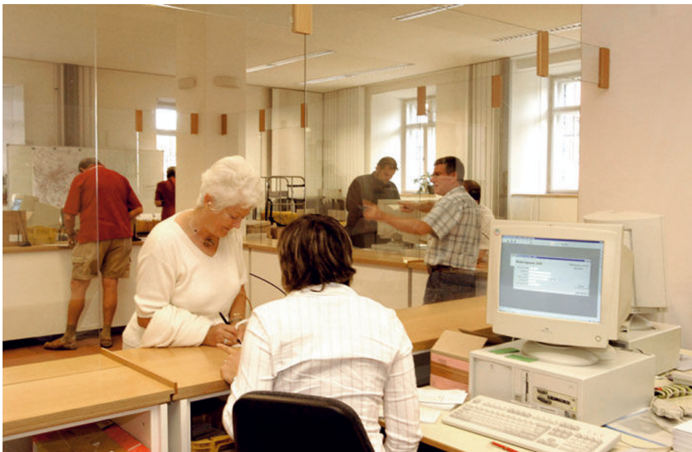
Eine typische Schaltersituation