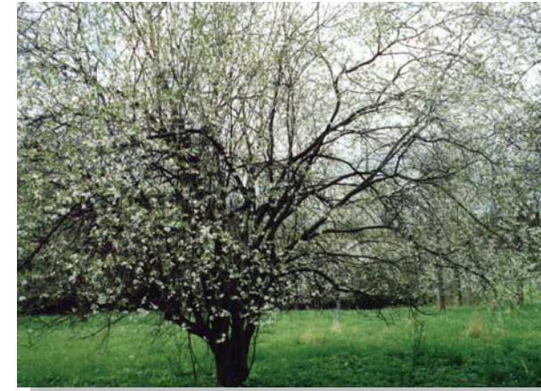
▲ Streuobstwiese im Pegnitztal

Obstbäume prägen seit Jahrhunderten unsere Kulturlandschaft. Als Streuobst werden hochstämmige, oft lokaltypische und robuste Obstbäume bezeichnet, welche die Landschaft entlang von Wegen, auf Äckern oder Wiesen prägen. Im Gegensatz zu modernen Obstplantagen werden sie nicht gedüngt oder mit chemischen Mitteln behandelt. So bieten sie in ihrer Umgebung einen Lebensraum für viele selten gewordene Pflanzen und Tiere, zum Beispiel Igel, Fledermäuse und gefährdete Vogelarten.