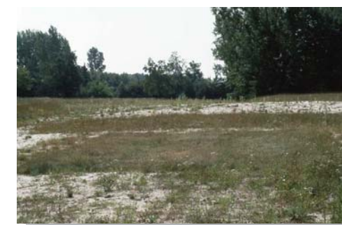
▲ Brachfläche am Volkspark Marienberg

Brachen sind durch menschlichen Einfluss entstandene, aber aktuell nicht bewirtschaftete Flächen. Sie haben als bereicherndes Element in der Stadt oder inmitten landwirtschaftlich intensiv genutzter Flächen eine große Bedeutung für die Erholung. Befragungen zeigen, dass die Nürnberger ihre Brachflächen regelmäßig nutzen und erhalten wollen. Anders als in gepflegten Grünanlagen mit eingezäuntem Spielbereich und vielen Reglementierungen können sich Kinder hier auf einem natürlichen Abenteuerspielplatz austoben. Brachen sind auch wichtige Mosaiksteine im Biotop-Verbund und dienen gefährdeten Tier- und Pflanzenarten als Rückzugsgebiete.