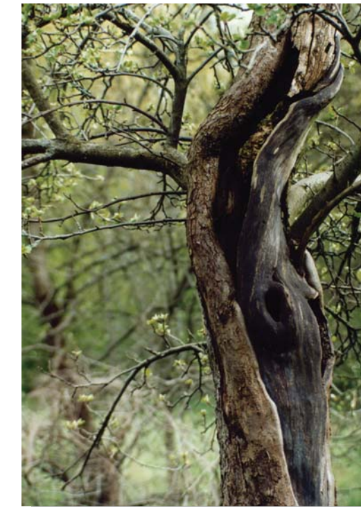
▲ alter Obstbaum mit Spechthöhle

Der LPV Nürnberg pflegt im Stadtgebiet Streuobstbestände vor allem auf trockenen und mageren Wiesen mit artenreichen Pflanzengemeinschaften. Die jährliche Pflegemaßnahme mit Entsorgung des Mähgutes verhindert, dass sich Nährstoffe anreichern. Durch die Neuanlage von Streuobstwiesen wird zusätzlicher Lebensraum geschaffen.