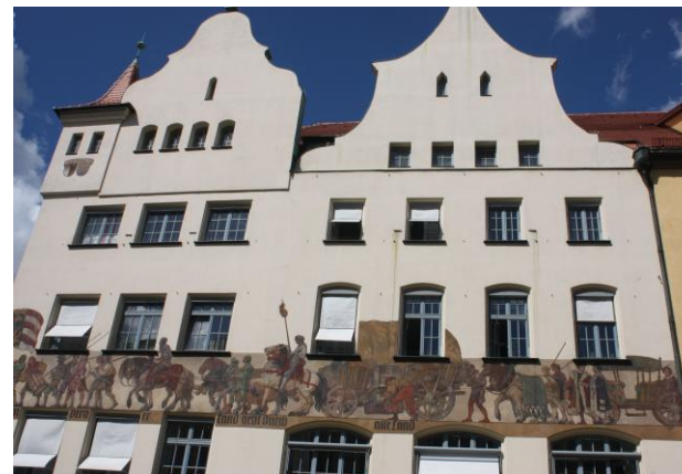
„Nürnberger Tand geht in alle Land“. Kaufmannszug am Haus der Industrie- und Handelskammer Nürnberg.

Das Amt für Internationale Beziehungen (IB) koordiniert seitdem internationale Kontakte, betreut Projekte der wirtschaftlichen, kulturellen und verwaltungstechnischen Zusammenarbeit und ist insbesondere für die Ausgestaltung der Städtepartnerschaften Nürnbergs zuständig. Zusätzlich hat IB die Federführung für die Mitgliedschaft Nürnbergs im Großstädte-Netzwerk EUROCITIES und organisiert darüber hinaus Großprojekte wie Hermann-Kesten-Stipendium, Festival der Partnerstädte, Markt der Partnerstädte und den Besuch ehemaliger jüdischer Bürger/innen.