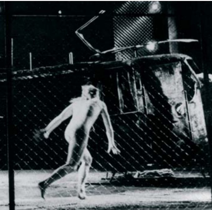
„Hitlerjunge Quex“ (links) setzte sich im Schauspielhaus unkonventionell, aber angemessen mit dem Nationalsozialismus auseinander. In den 1970er Jahren versetzten nackte Darsteller in „Der Architekt und der Kaiser von Assyrien“ das Publikum in Aufregung.