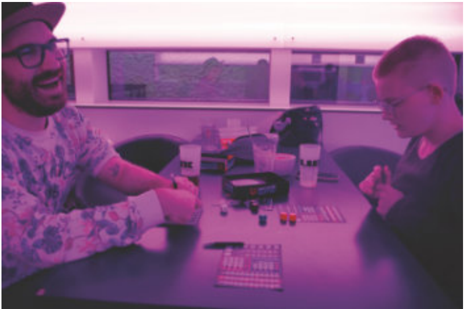
Spieleabend in LUX