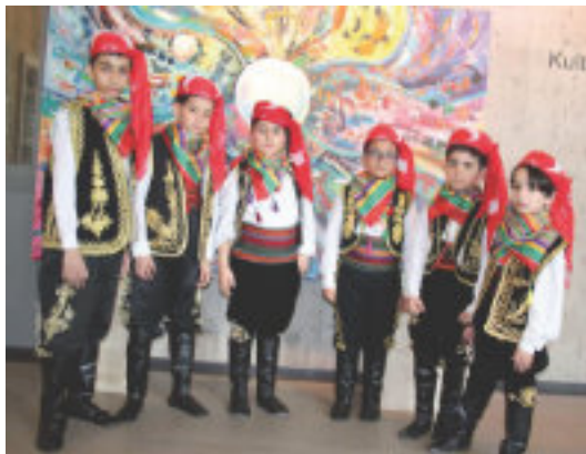
Selbst der Nachwuchs tanzt.

Mein herzlicher Dank gilt allen teilnehmenden Tanzgruppen und großzügigen unterstützenden Sponsoren.