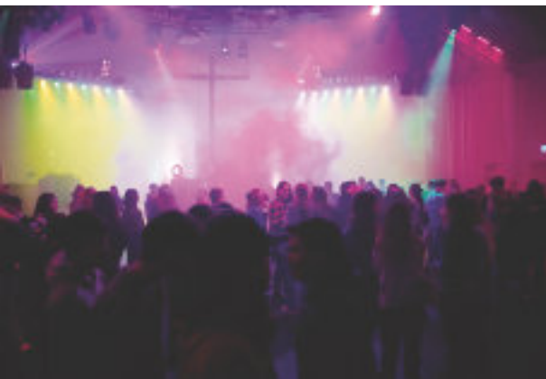
You've got to fight for your right to paarty.

BeReal – sei echt! Eine App, eine Aufforderung. Doch was heißt es, „real“ zu sein? Am 4. Februar haben wir uns diese Frage im Rahmen eines Gottesdienstes gestellt. Wie lebt es sich unverstellt? Mal sagen, was man sagen will. Machen, was man machen will. Ohne wenn und aber.