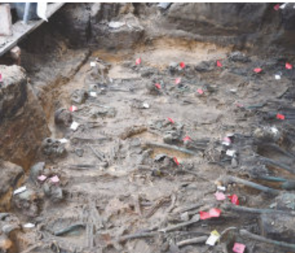
Blick in die Baugrube mit den gefundenen Skeletten.

klärt Oberbürgermeister Marcus König an der Grabungsstelle. „Ein sensibler und angemessener Umgang mit diesem historisch und archäologisch bedeutenden Fund ist selbstverständlich.“