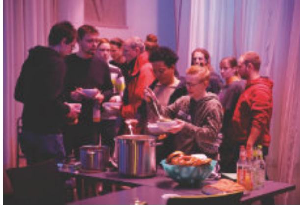
Schrottwichteln damit Ungeliebtes doch noch einen Platz findet.

Im Anschluss an den Gottesdienst gab es noch leckeren Spinat-Pilz-Braten mit Rosenkohl (was besser schmeckt als es klingt), einen Toast