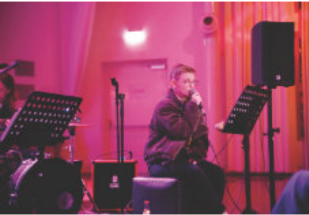
Sei du selbst!

liebsten Spiel mitbringen, egal ob Brettspiel, Kartenspiel oder Quiz: Alles war da. Zusammen mit leckeren Wraps und viel Gemeinschaft.