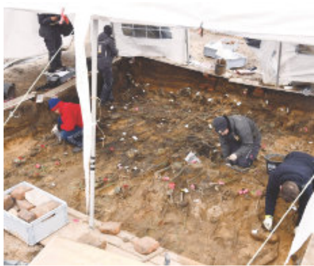
Die beigefügten Bilder geben Einblicke in das Grabfeld 3, insgesamt handelt es sich um 8 Gräberfelder.

„Wir werden alle menschlichen Überreste sichern und archivieren, die in den künftigen Baufeldern gefunden werden. Wir nehmen derzeit an, dass es sich nach Abschluss der Arbeiten im Frühjahr um den größten in Europa ergrabenen Notfriedhof für Pesttote handelt“, stellen Melanie Langbein und Florian Melzer im Rahmen eines Pressetermins fest.