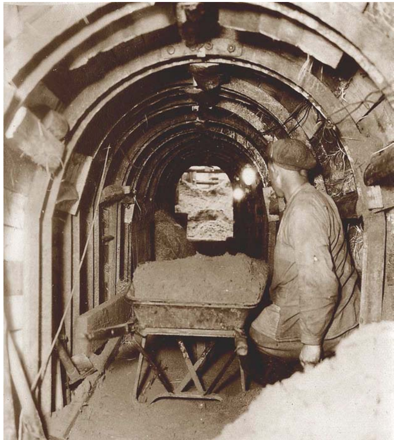
Bergmännische Unterquerung der Ringstraße vom Regenüberlauf Spittlertorgraben zur Rosenau. Der Stollen wird mit Stahl- Ausbaubögen und Holzverbau gesichert.