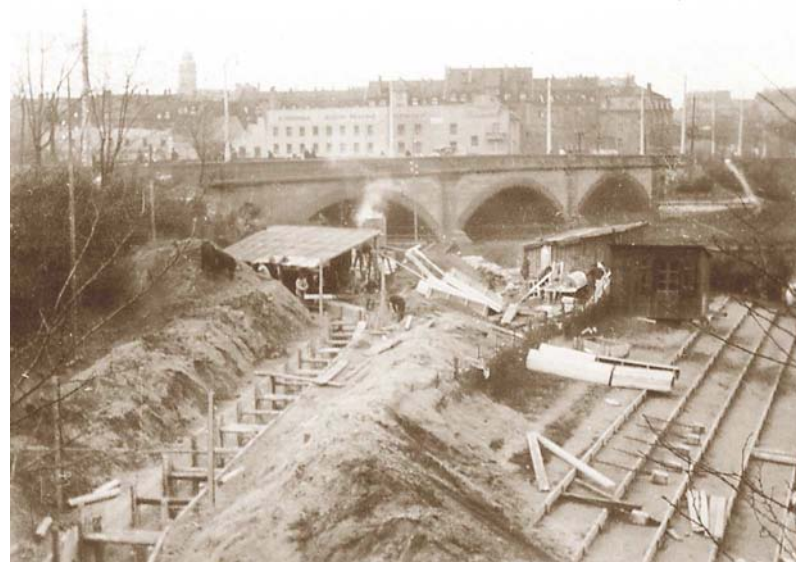
Bauarbeiten am Hauptzuführungskanal auf der Deutschherrnwiese. Blick nach Nordwesten, im Hintergrund die Johannisbrücke.

Nachdem ehrgeizige Pläne aus dem Jahr 1908 für eine zentrale Kläranlage aus Kostengründen nicht weiterverfolgt wurden, errichtete man in einem ersten Schritt eine Kläranlage am Ende des Südlichen Hauptsammlers an der Maximilianstraße. Sie ging im Jahr 1913 mit dem Namen „Kläranlage Süd“ (heute Klärwerk 2) in Betrieb. Sie war die erste Großkläranlage Bayerns.