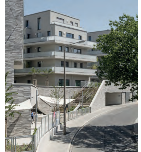
Offene Südseite mit Aussenbereich Kita