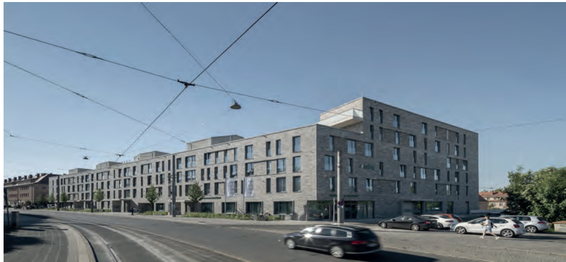
An der Johannisstraße