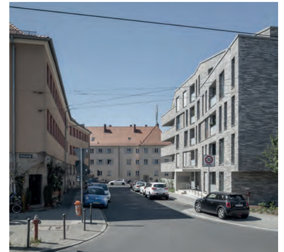
Räumlicher Dialog mit dem historischen Bestand