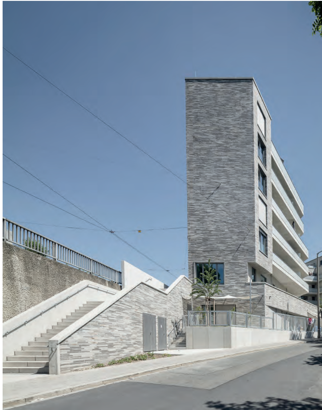
Ansicht Süd mit Kita

Verschiedene Einkommens- und Nutzergruppen werden in das Gebäude integriert. Es wurde dabei bewusst kein Unterschied in der Anmutung zwischen geförderten und freifinanzierten Wohnungen gemacht.