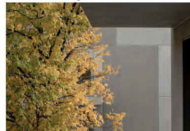
Fassade mit gefärbten Elementen