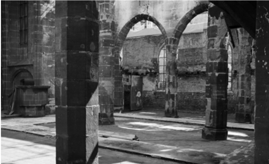
Nach dem Brand 2014