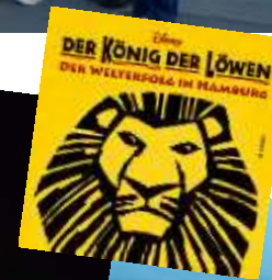
Faszinierend und emotional