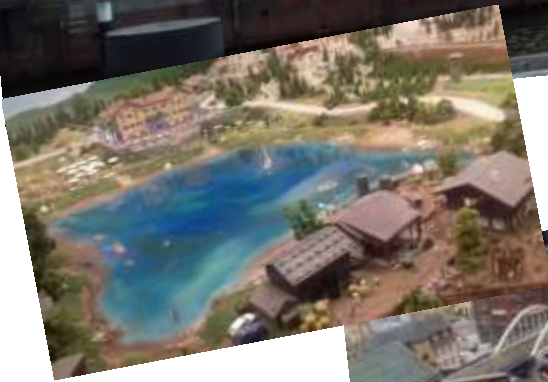
Miniatur Wunderland Hamburg