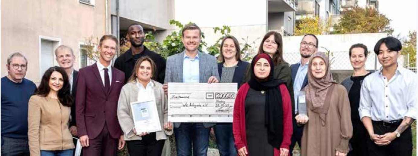
Übergabe des Preisgelds an We Integrate e.V.: In der Mitte Oberbürgermeister Marcus König mit Sozialreferentin Elisabeth Ries, sowie Markus Lang, Vertreter des Bundesamts für Migration und Flüchtlinge (4. von links)

Mittlerweile besitzt mehr als die Hälfte (51,6 %) der Nürnberger Bevölkerung eine nichtdeutsche Staatsangehörigkeit oder sie sind Deutsche mit Zuwanderungsgeschichte. Vor allem sprachliche Hürden tragen dazu bei, dass diese Bevölkerungsgruppe besonders gefährdet ist, von digitaler Teilhabe ausgeschlossen zu werden. Ohne digitale Grundkompetenzen werden Online-Formulare oder Terminvereinbarungen schnell zu einem echten Stolperstein für soziale Teilhabe. Um dem zu begegnen, braucht es niedrigschwellige, kultursensible und wohnortnahe Bildungsangebote. Diese sollten dort stattfinden, wo die Menschen leben und sich wohlfühlen. Lokale Zentren wie Stadtteil- oder Kulturläden können Technikzugang, Beratung und Unterstützung bieten und soziale Netzwerke stärken.