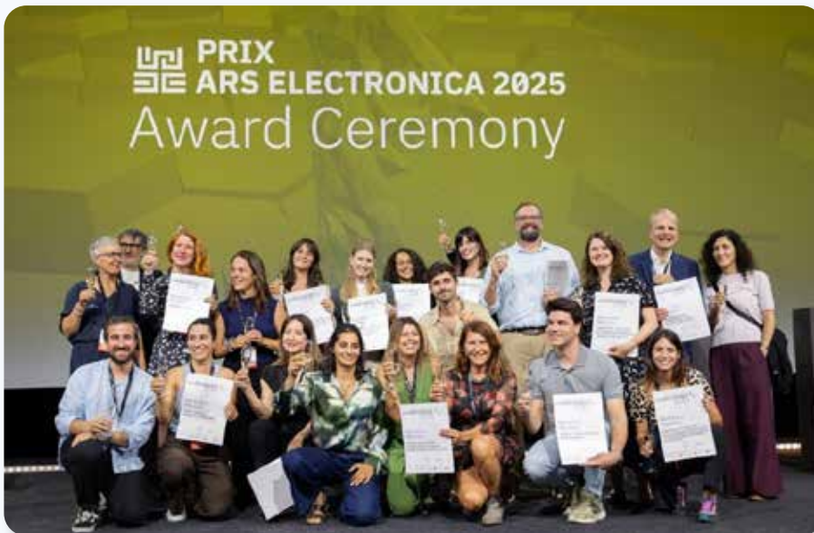
Preisträgerinnen und Preisträger des European Union Prize for Citizen Science in Linz: Honorary Mention

Das Citizen-Science-Projekt „Nürnberg forscht“ wurde mit einer Honorary Mention beim European Union Prize for Citizen Science ausgezeichnet. Damit zählt es zu den 30 europäischen Initiativen, die für ihre gesellschaftliche Relevanz, ihren innovativen Forschungsansatz und ihre partizipative Wirkung geehrt wurden. Die Auszeichnung wird von der Europäischen Kommission finanziert und im Rahmen des Ars Electronica Festivals in Linz verliehen. Am 4. September nahm das Projektteam die Ehrung vor Ort entgegen und nutzte den Festivalbesuch, um vielfältige künstlerisch-wissenschaftliche Installationen zu aktuellen Zukunfts- und Technologiefragen zu erleben.