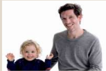
Väter und das Elterngeld(Plus)

Elternzeit gestalten bei der Stadt Nürnberg - 3. Städtische Familienkonferenz - 05.04.2017