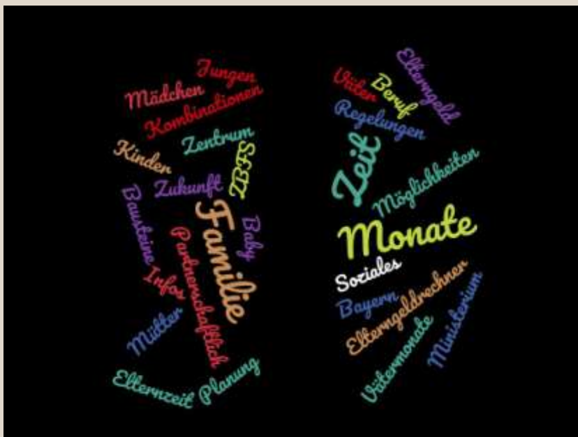
Elternzeit gestalten bei der Stadt Nürnberg - 3. Städtische Familienkonferenz - 05.04.2017