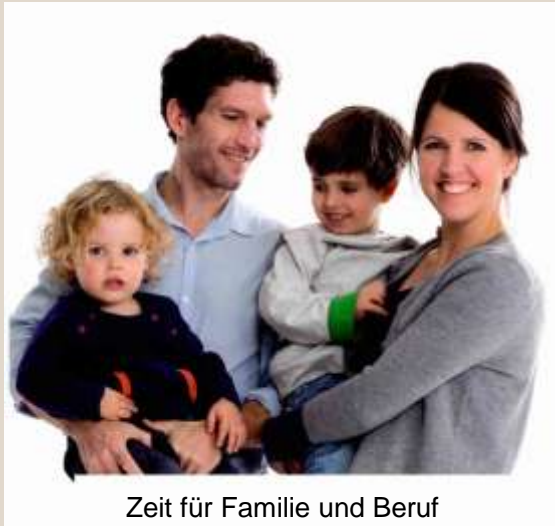
Zeit für Familie und Beruf