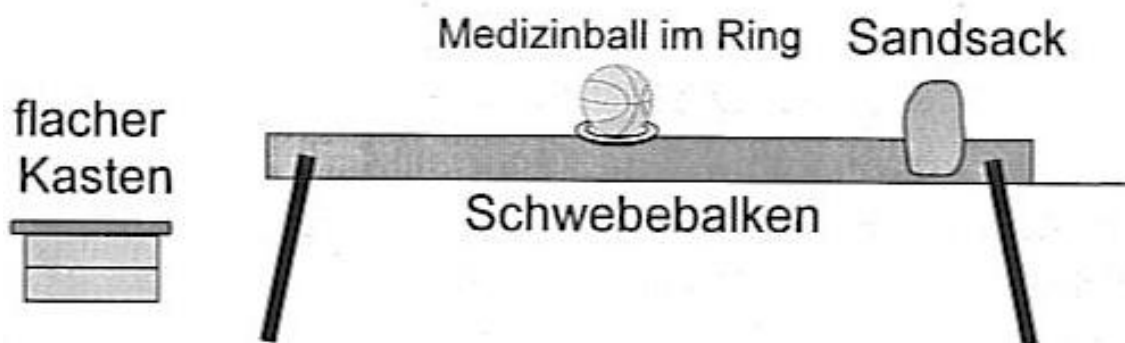
Abbildung 2 3

Die Testperson balanciert über den Balken und nimmt am Ende des Balkens den Sandsack mit einer Hand auf, übertritt die Wendemarkierung, macht eine halbe Drehung und transportiert die Zusatzlast in einer Hand zum Balkenanfang. Innerhalb dieser Wendemarkierung dreht die Testperson erneut um, verlagert die Zusatzlast in die andere Hand und transportiert sie zurück. Am Ende des Balkens wird der Sandsack in der Wendemarkierung abgelegt. Nach einer abschließenden halben Drehung balanciert die Testperson zurück und steigt über den Kasten kontrolliert ab. Während des Balancierens wird der Medizinball jeweils in der Mitte des Balkens überstiegen (kein seitliches Vorbeiführen der Beine).