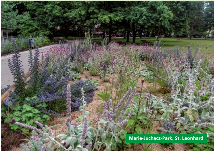
Marie-Juchacz-Park, St. Leonhard