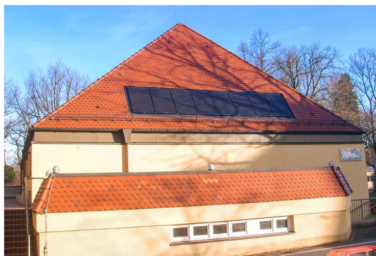
Sperberschule Hortgebäude (Denkmalnähe): dachintegrierte PV-Anlage in schwarz