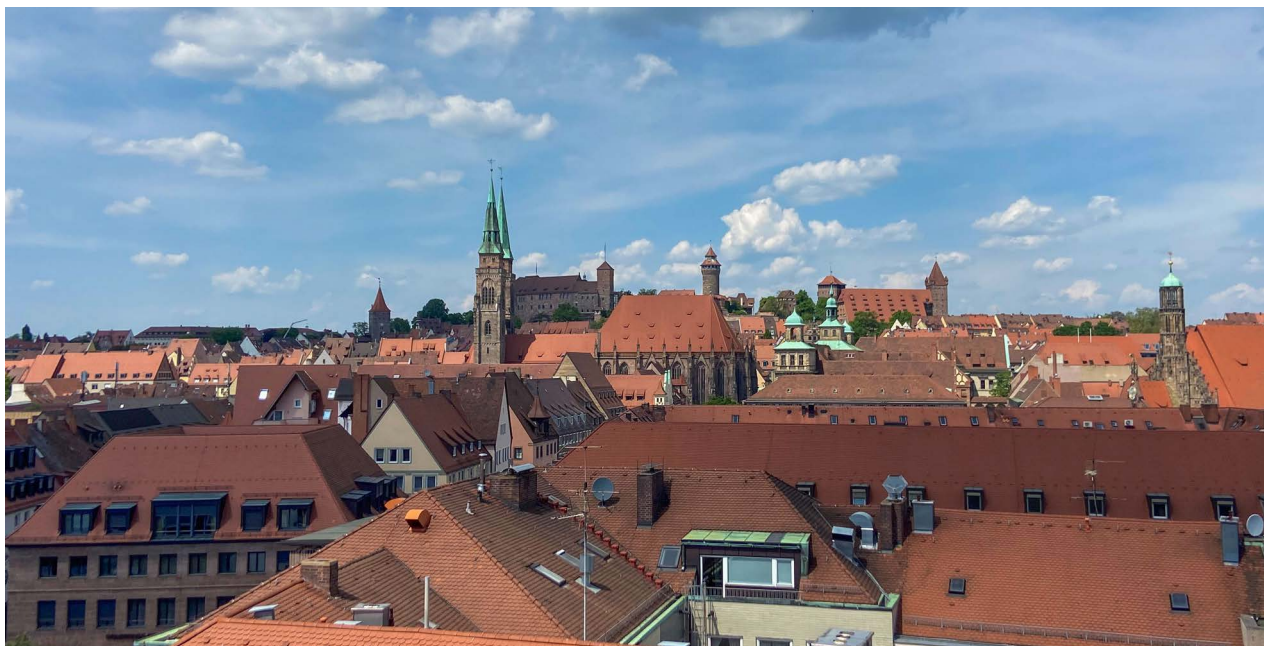
Dachlandschaft der Nürnberger Altstadt