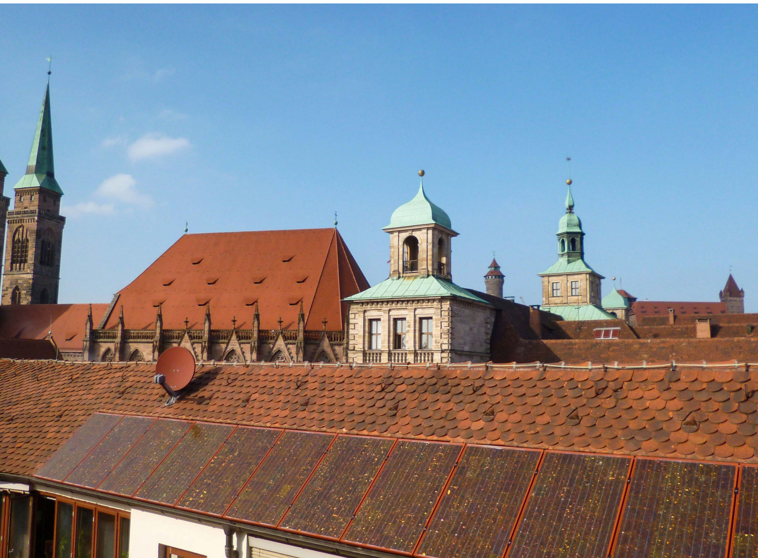
Ensemble Altstadt – Innenhof Neues Rathaus: farblich angepasste PV-Anlage dachintegriert

Bei der Anbringung von Solarmodulen ist eine Integration in das Erscheinungsbild der Dächer und Dachlandschaften in einem denkmalverträglichen Maß ausschlaggebend.