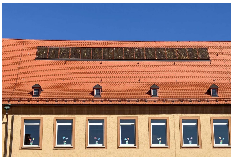
Ensemble Gartenstadt – Regenbogenschule: dachintegrierte PV-Module in rot

Beispielhaft sei hier die Haus- und Dachlandschaft der Nürnberger Altstadt erwähnt, welche kulturelle Identität vermittelt sowie touristisch und wirtschaftlich bedeutsam ist. Ihr Erhalt ist daher weiterhin ein wichtiges Ziel denkmalpflegerischen Handelns.