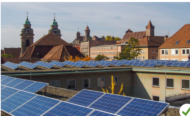
Ensemble Altstadt – Willstätter Gymnasium: PV-Anlage nach Süden aufgeständert

Gelungene Beispiele der Situierung einer Solaranlage: