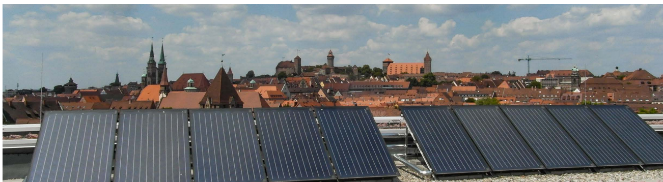
Ensemble Altstadt – Luitpoldhaus: Solarthermieanlage

Solaranlagen auf Flachdächern, an Balkonbrüstungen und an Fassaden bedürfen einer besonderen und optimierten Planung und werden einzelfallbezogen betrachtet. (Sonderfälle S. 6)