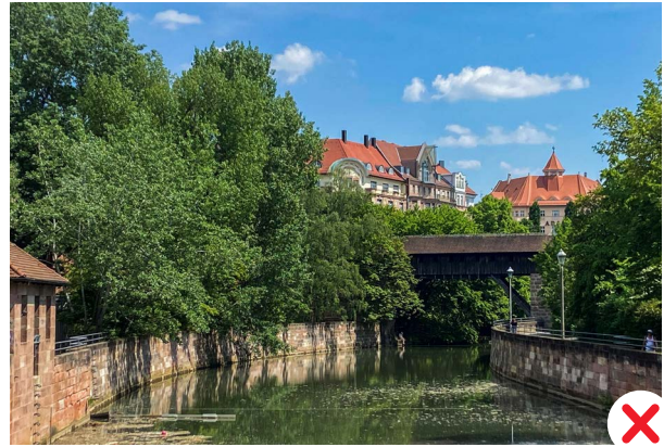
Ensemble Altstadt – Blick von der Insel Schütt Richtung Prinzregentenufer

In folgenden Fällen ist die Installation einer Solaranlage nicht denkmalverträglich umsetzbar: