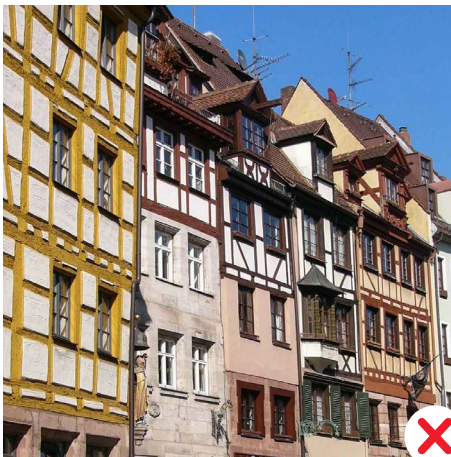
Ensemble Altstadt – Weißbergergasse

In folgenden Fällen ist die Installation einer Solaranlage nicht denkmalverträglich umsetzbar: