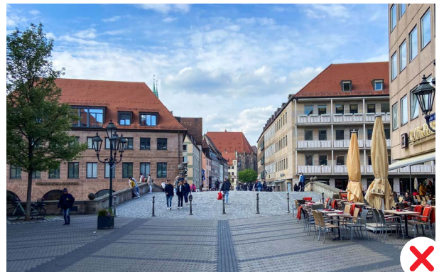
Ensemble Altstadt – Fleischbrücke mit Blickrichtung St. Sebald

Diese Orte sind als repräsentative Kernzonen der Altstadt, zum Teil mit zugehörigen Stadtbausteinen, nicht geeignet für Solaranlagen: