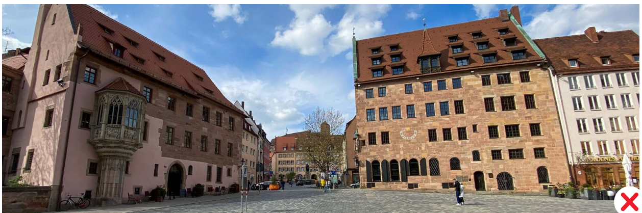
Ensemble Altstadt – Sebalder Platz mit Sebalder Pfarrhof