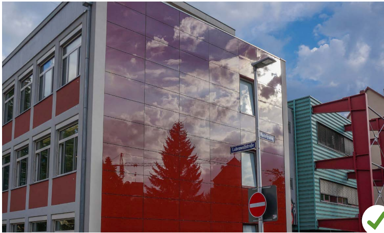
Ensemble Altstadt – Labenwolf-Gymnasium: farbige Fassadenphotovoltaik am Einzeldenkmal