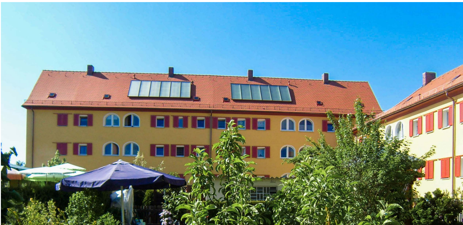
Ensemble Gartenstadt – Julius-Loßmann-Straße: Solarthermieanlage zum Innenhof hin

Vorbehaltlich gesetzlicher Änderungen und weiterer Entwicklungen. Die Stadt Nürnberg behält sich vor, diese Richtlinie anzupassen und fortzuschreiben.