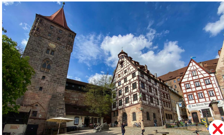
Ensemble Altstadt – Pilatushaus, Obere Schmiedgasse / Tiergärtnerplatz

Gelungene Beispiele der Situierung einer Solaranlage: