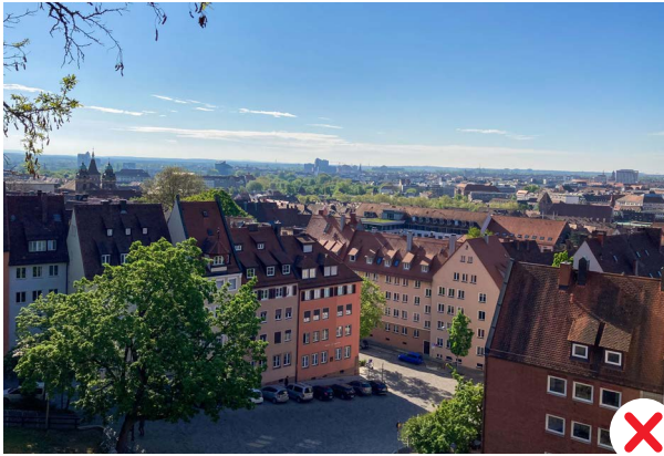
Ensemble Altstadt – Blick von der Burgfreieung