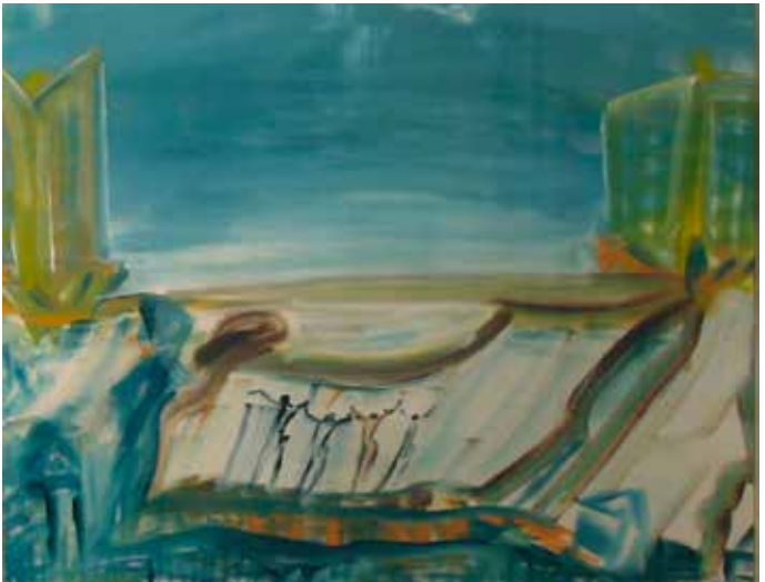
Gemälde von Riza Özlek, langjähriger GOHO-Teilnehmer

Veranstalter: Gostenhofer Künstler/innen unterstützt durch das Nachbarschaftshaus Gostenhof