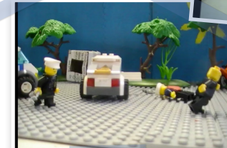
Stop-Motion-Animation 5. Klasse (auch auf Seiten 1 und 3)