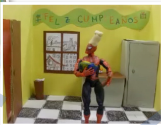
Filmprojekt „Falsos amigos“ Spanisch spätbeginnend - Q 11