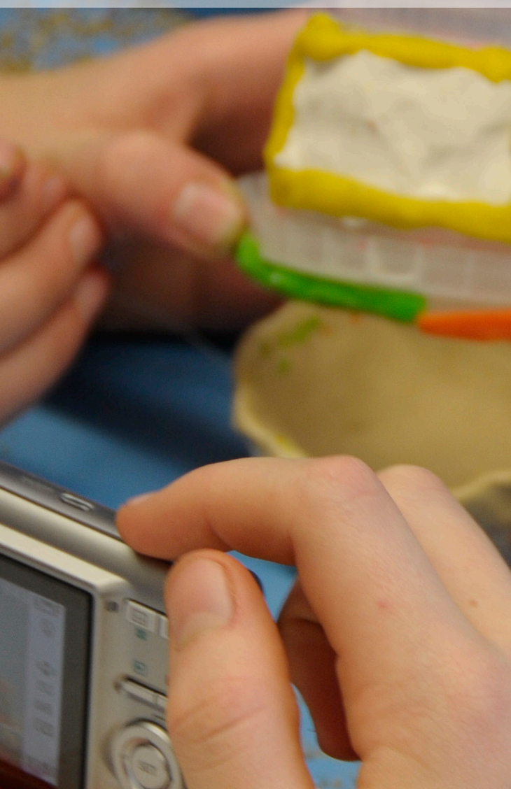
Filmarbeit im Klassenverband der 5. und 6. Klasse