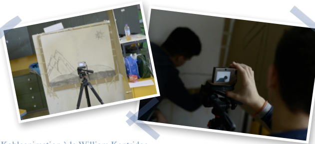
Kohleanimation à la William Kentridge 9. Klasse