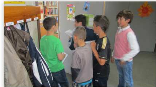
Ist auch im Klassenzimmer Energie?