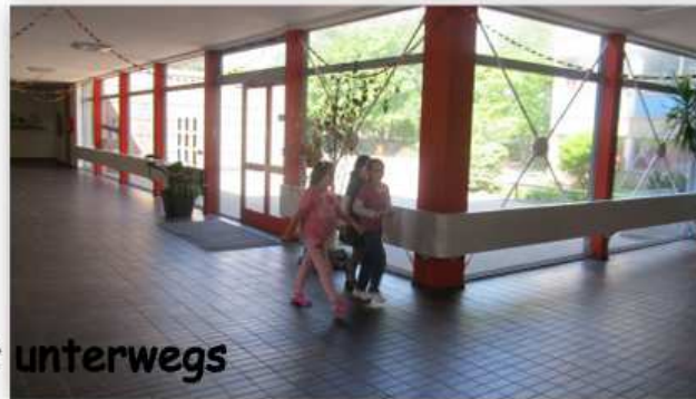
Energiespürnasen im Schulhaus unterwegs