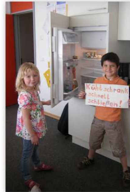
& geben gute Ratschläge