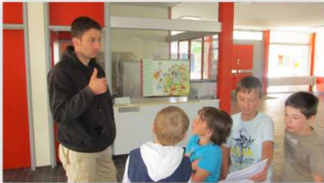
Wir befragen unseren Hausmeister