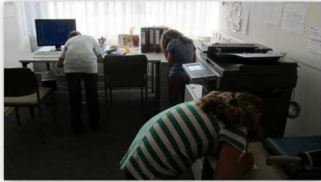
Wir suchen sogar im Lehrerzimmer