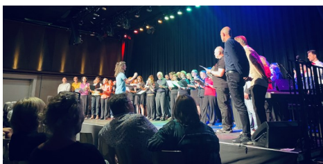
Das regnerische Wetter konnte den Sängerinnen und Sängern bei der Chor:Begegnung am 6.7. nichts anhaben. Im großen Saal wurde in festlicher Atmosphäre gesungen, mitgesungen und sogar getanzt!