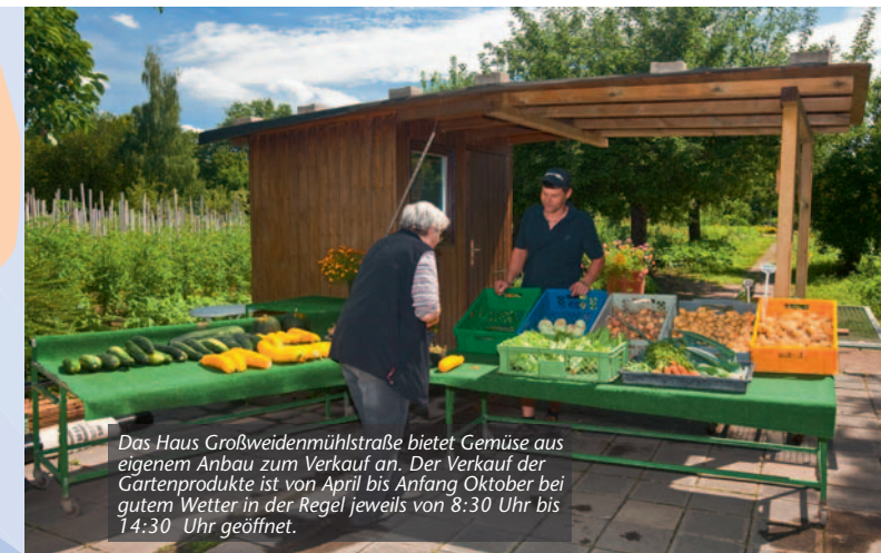
Das Haus Großweidenmühlstraße bietet Gemüse aus eigenem Anbau zum Verkauf an. Der Verkauf der Gartenprodukte ist von April bis Anfang Oktober bei gutem Wetter in der Regel jeweils von 8:30 Uhr bis 14:30 Uhr geöffnet.