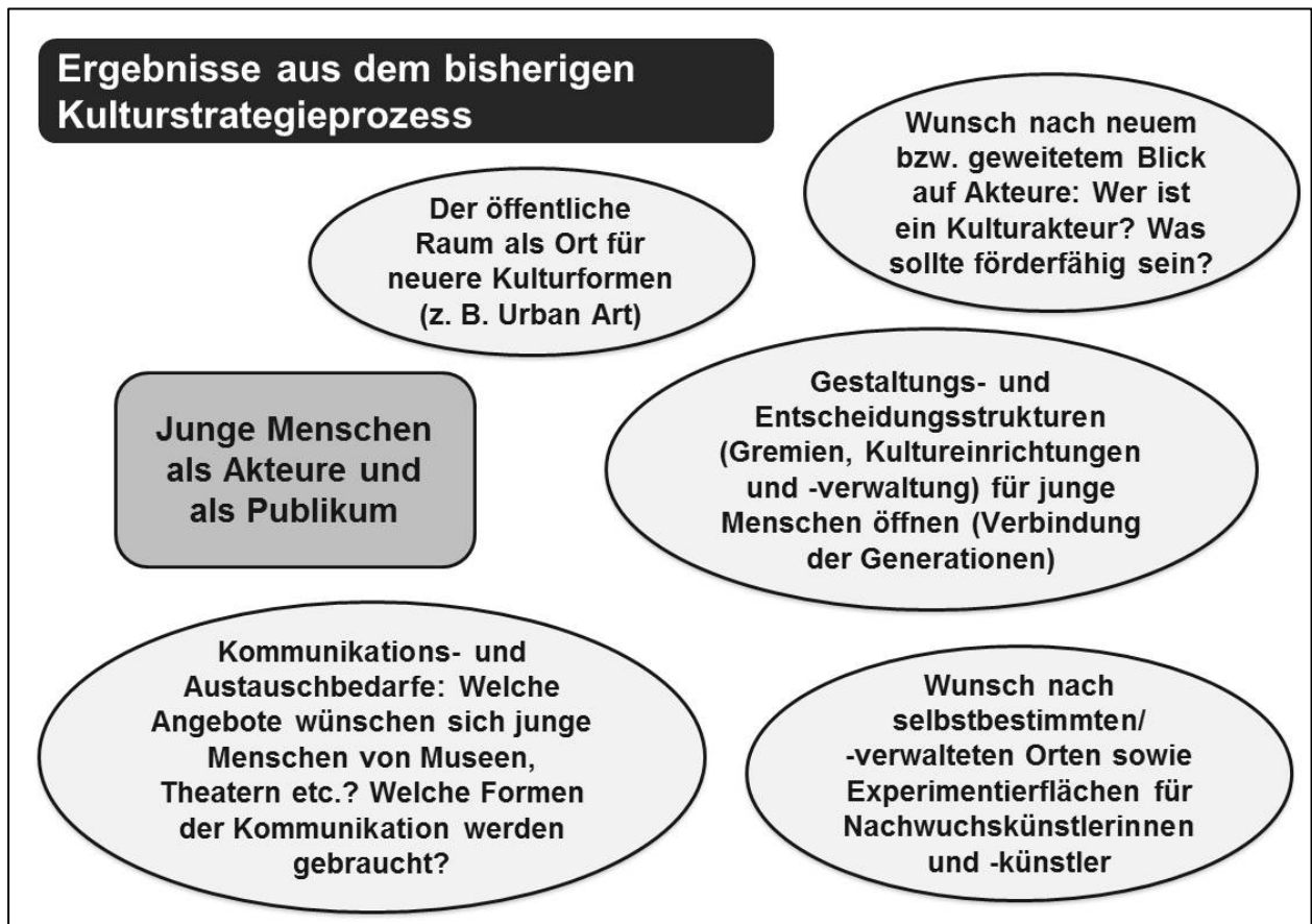
Abb. 4: Bisher identifizierte jugendspezifische Herausforderungen im Kulturstrategieprozess