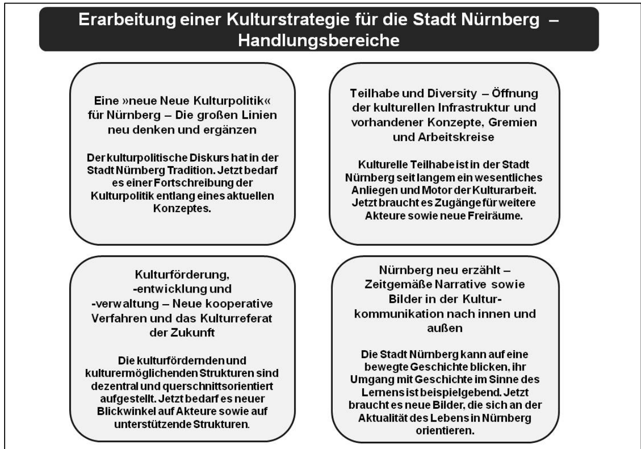
Abb. 2: Handlungsbereiche für die Erarbeitung einer Kulturstrategie für die Stadt Nürnberg

Die nachfolgend vorgestellten Handlungsbereiche stützen sich auf die Ergebnisse aus den Experteninterviews und der Online-Befragung sowie auf Anregungen aus dem prozessbegleitenden Beirat. Die Handlungsbereiche stellen die Basis für den 1. Kulturworkshop am 25. September 2017 dar und wurden dort mit weiteren Handlungsdesideraten und Maßnahmenansätzen unterfüttert (s. Kap. 1.2.3).