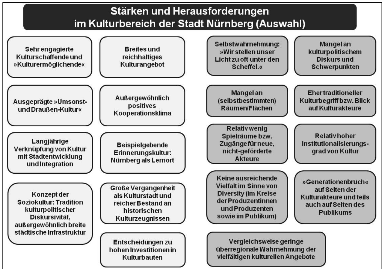
Abb. 1: Auswahl von Stärken und Herausforderungen im Kulturbereich der Stadt Nürnberg.