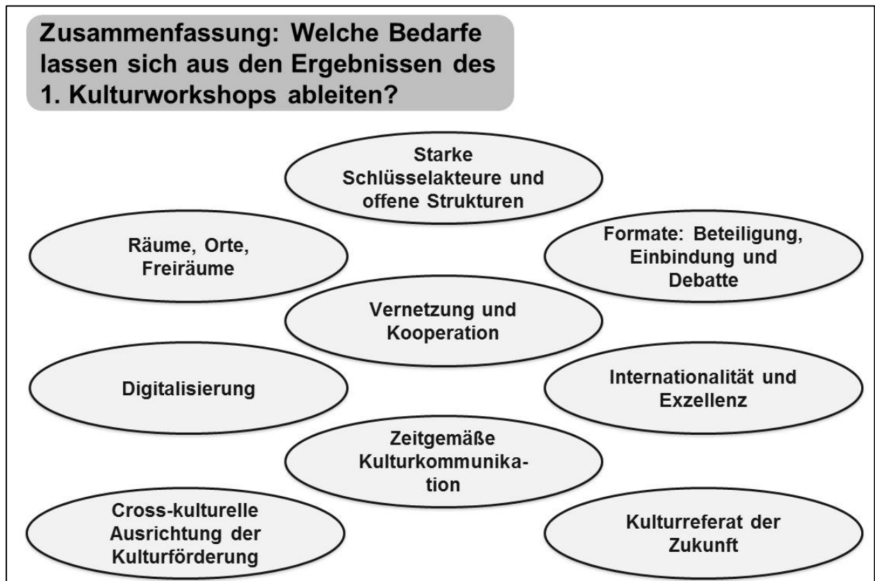
Abb. 3: Zentrale Herausforderungen aus dem 1. Kulturworkshop