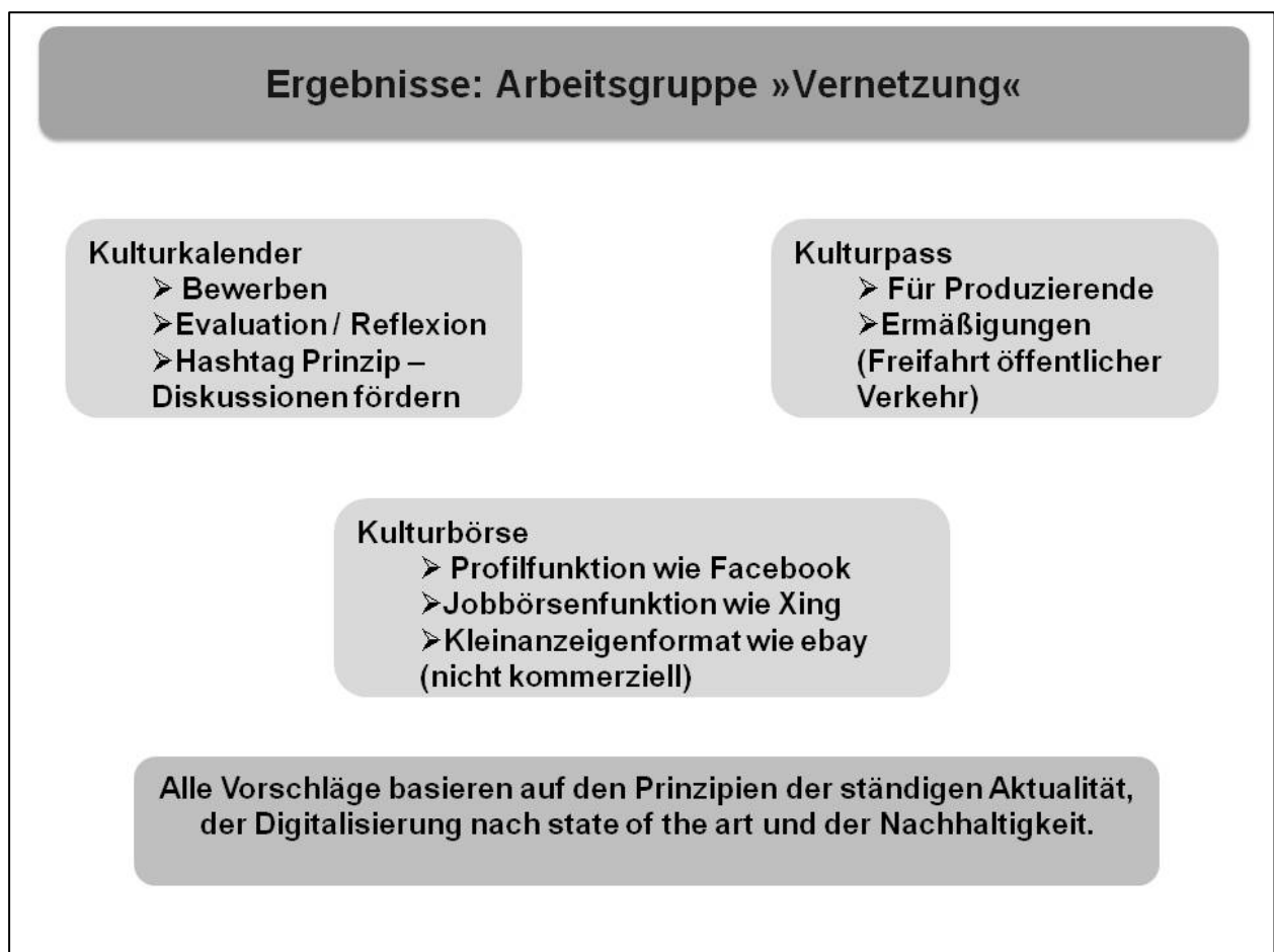
Abb. 6: Ergebnisse der Arbeitsgruppe »Vernetzung«

Die vorgestellte Kulturbörse vereinigt Funktionen verschiedener sozialer Medien. Die Erstellung von eigenen Profilen für Kulturschaffende, eine Jobbörse für den kulturellen Sektor der Stadt und ein nicht kommerzielles Kleinanzeigenformat sollen Austausch und Vernetzung befördern sowie Ressourcen (technisches Equipment) leichter zugänglich machen. Auch offizielle Ansprechpartnerinnen und Ansprechpartner für die Kulturförderung können auf diese Weise kontaktiert werden.