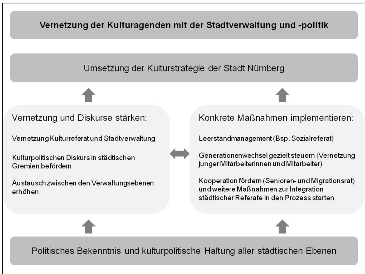
Abb. 5: Vernetzung der Kulturagenden mit Stadtverwaltung und -politik