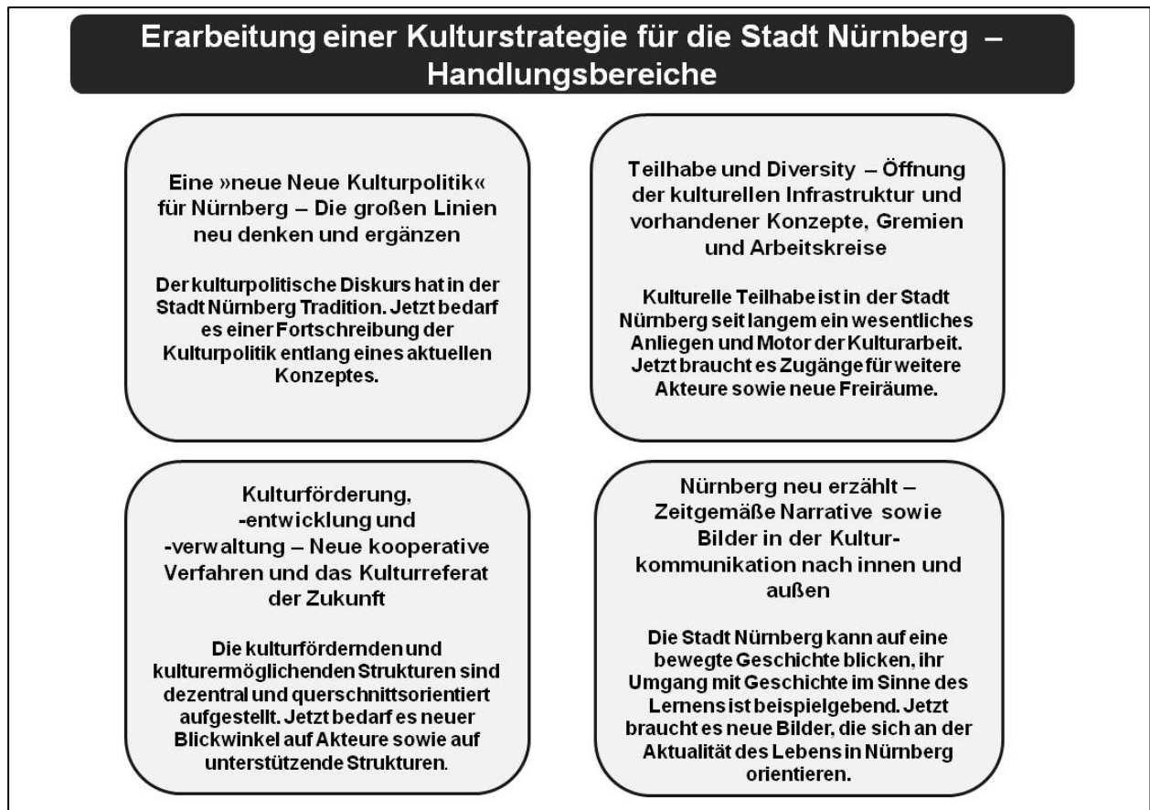
Abb. 2: Handlungsbereiche für die Erarbeitung einer Kulturstrategie für die Stadt Nürnberg