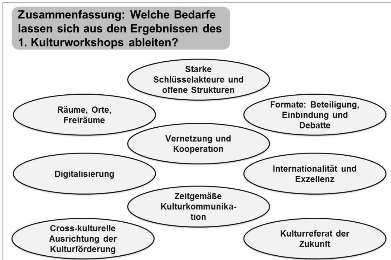
Abb. 3: Zentrale Herausforderungen aus dem 1. Kulturworkshop