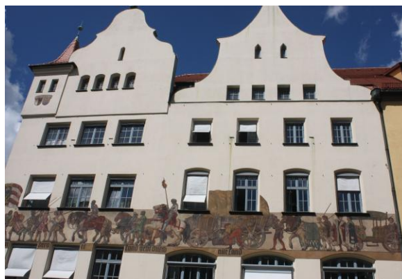
„La merce di Norimberga si vende dappertutto“ Treno merci presso la Camera dell'Industria e del Commercio di Norimberga

Da allora, il dipartimento per le relazioni internazionali (IB) ha coordinato tutti i contatti internazionali della città. Gestisce progetti economici, culturali e amministrativi ed è responsabile dell'organizzazione dei gemellaggi di Norimberga. Inoltre, IB gestisce la partecipazione di Norimberga nell'ÉUROCITIES, la rete delle città europee, e organizza importanti progetti come la borsa di studio "Hermann Kesten", il festival estivo delle città partner, il mercatino di Natale delle città gemellate e la visita di ex cittadini di Norimberga di credo ebraico.