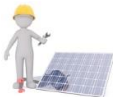
Photo-Voltaik-Anlagen zur Energie-Gewinnung

Auch in der Corona Krise unterstützten wir unsere Partner-Städte, wenn sie es wollten.