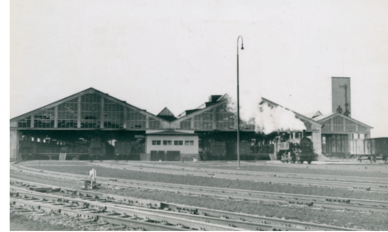
Die Umladehallen mit dem Turm der Jubiläumsausstellung, Fotografie 1935