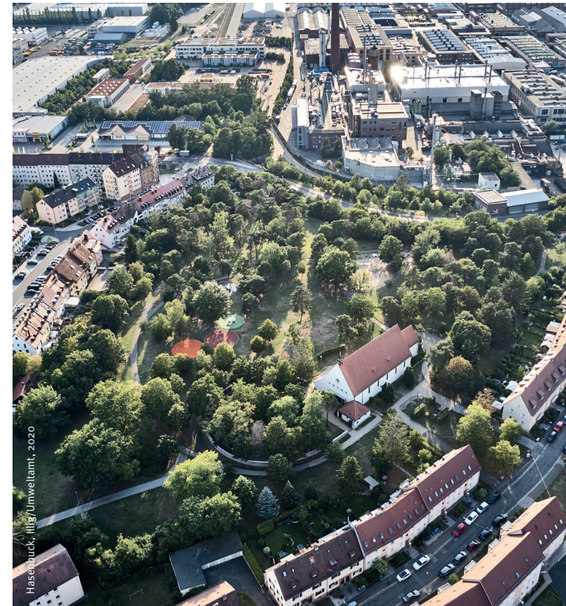
Hasenbuck, ilig/umweltamt, 2020