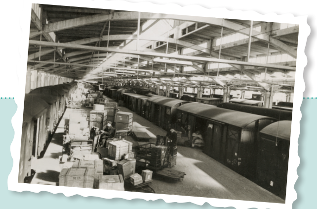
Das Innere der Umladehallen, Fotografie 1936

Nach dem Zweiten Weltkrieg wurden die Hallen ab 1950 in Betonbauweise wieder aufgebaut und dienten erneut dem Umschlag von Stückgut. Mit der Privatisierung der Logistiksparte der Bahn wurde der Betrieb 1998 eingestellt. Trotz Protesten und vorgelegter Umnutzungskonzepte wurden die Hallen im Jahr 2018 abgebrochen.