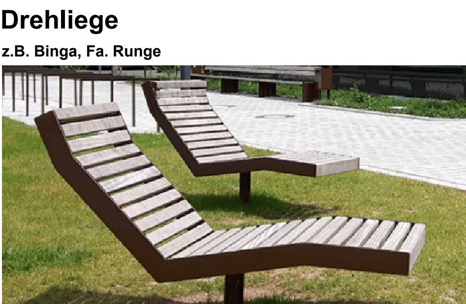
Drehliege z.B. Binga, Fa. Runge