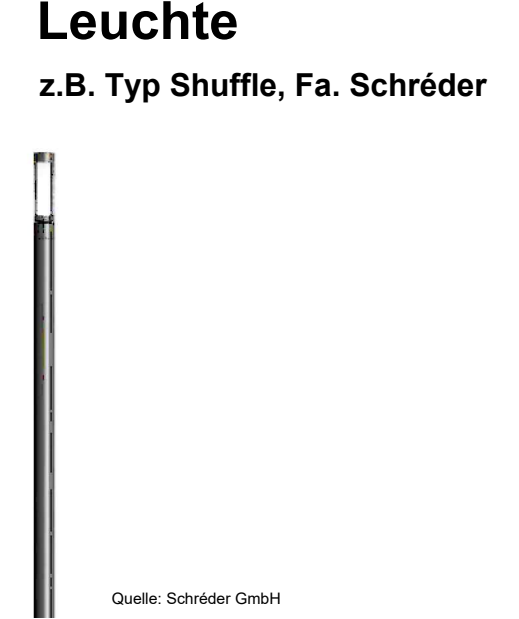
z.B. Typ Shuffe, Fa. Schröder