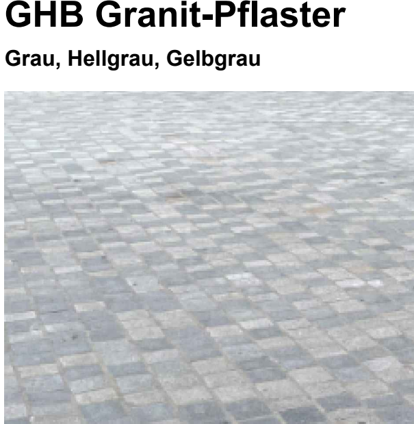
GHB Granit-Pflaster Grau, Hellgrau, Gelbgrau