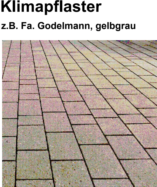
z.B. Fa. Godelmann, gelbgrau