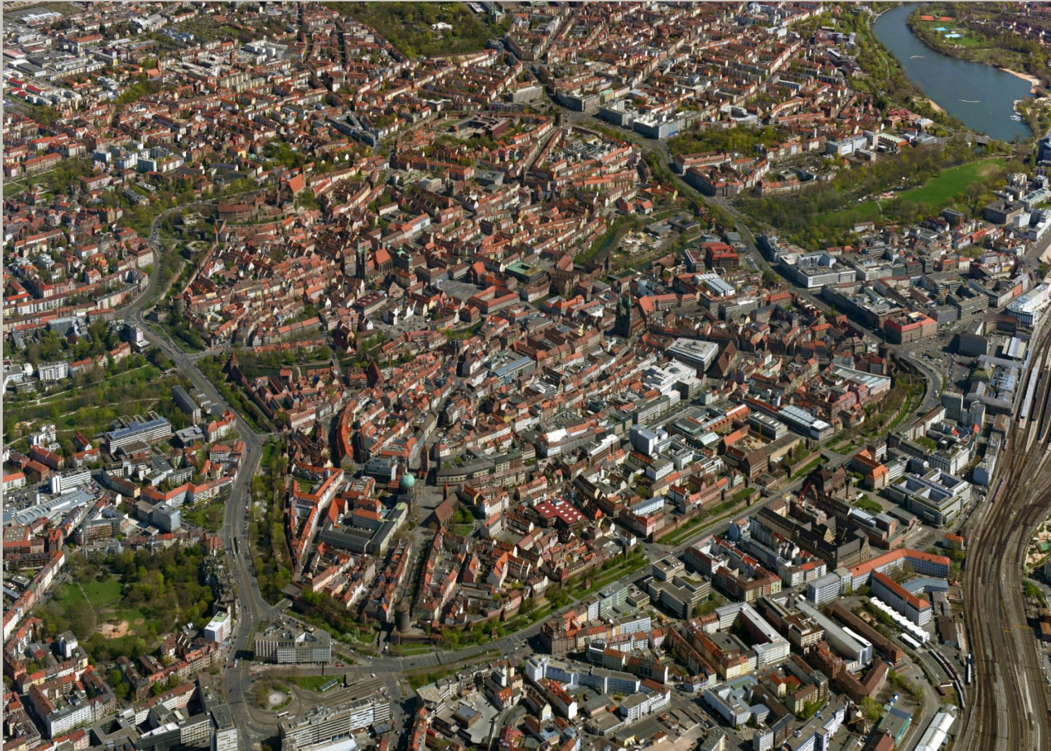
Nürnberg Luftbild, Hajo Dietz