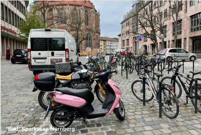
Parken vs. Fußgängerzone