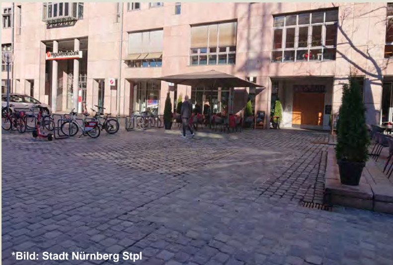
Planung öffentlicher Raum, Gestaltung, Licht