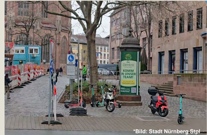
Konträre Ansprüche: Motorisierter Verkehr Barrierefreiheit Zugang zur Stadtmitte