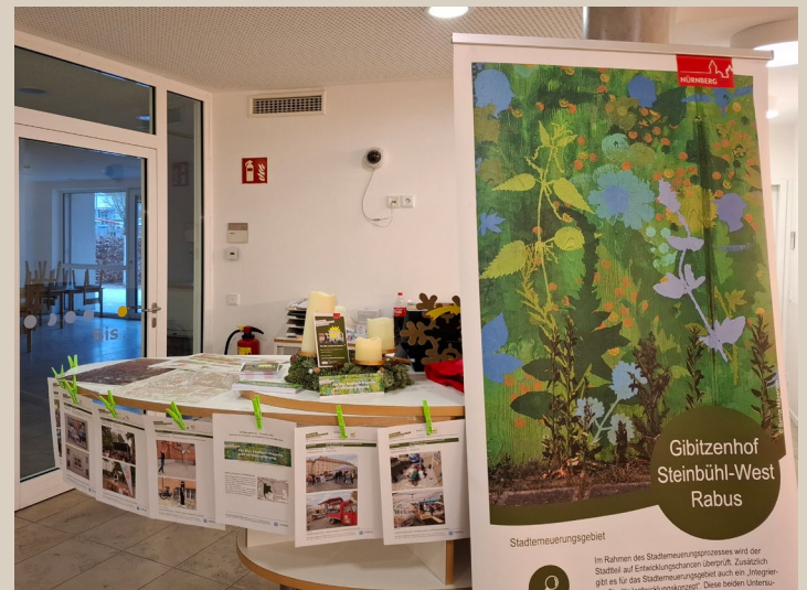
Gibi Winter Infostand