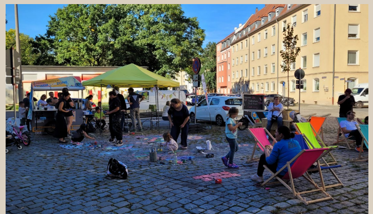
umgenutztes Parkdreieck Singerstr.