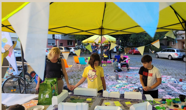
Besucher:innen betrachten das 3-D Modell