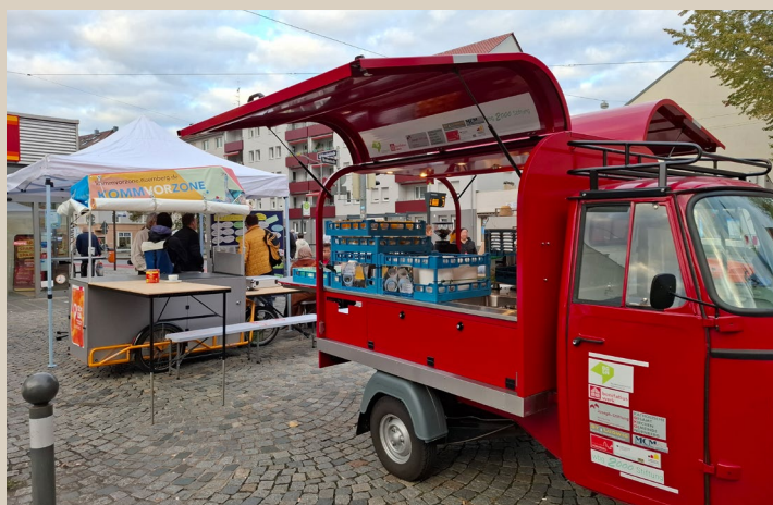
Impressionen der Beteiligungsveranstaltung