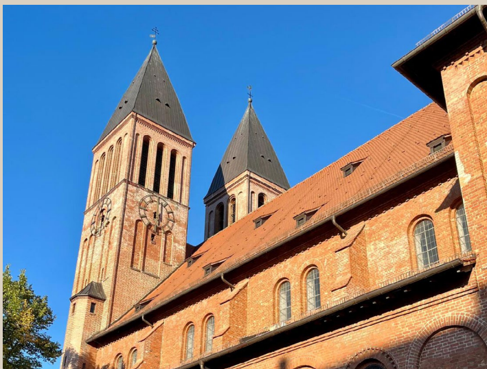
Türme St. Ludwigkirche