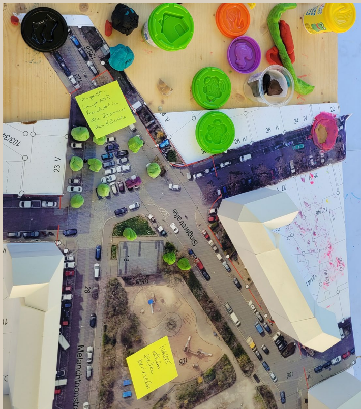
Ausschnitt 3-D-Modell

Dieses Jahr war das Quartiersbüro zusammen mit der KommVorZone dabei. Das sonst zugeparkte Dreieck am südlichen Ende des Melanchthonplatz wurde für einen Nachmittag zum Begegnungs- und Mitmachraum. Dieter Blase diskutierte am Modell mit interessierten Besucher:innen Ideen zur beabsichtigten Umgestaltung des Platzes.