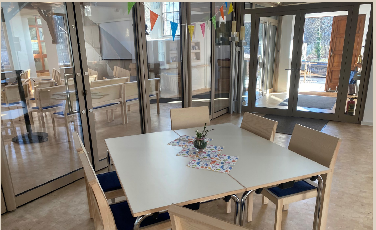
FreiRaum in St. Markus Kirche

https://www.sanktmarkus-nuernberg.de/files/gemeindebriefe/Gemeindebrief_online_2025.12.pdf