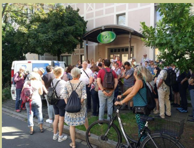
Großes Interesse ....

Am 21. September boten das Quartiersmanagement Weststadt und die Stadterneuerung Nürnberg gemeinsam mit „Geschichte für Alle e.V.“ zwei Stadt(ver)Führungen an. Die Spaziergänge führten die Besucher nördlich der Fürther Straße zwischen Maximilianstraße und Plärrer.