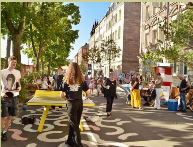
Eröffnung des Superblocks Gostenhof

Am 19. September, dem diesjährigen Internationalen Parking Day, war es soweit: Die Initiatoren feierten mit den Anwohnerinnen und Anwohnern, Interessierten und Unterstützenden den offiziellen Start.