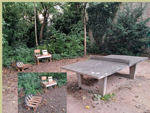
Rosenaupark: Tribünenplätze in Eigeninitiative entstanden

Herzlichen Dank für die Zusammenarbeit mit Ihnen, alle Gespräche und Anregungen!