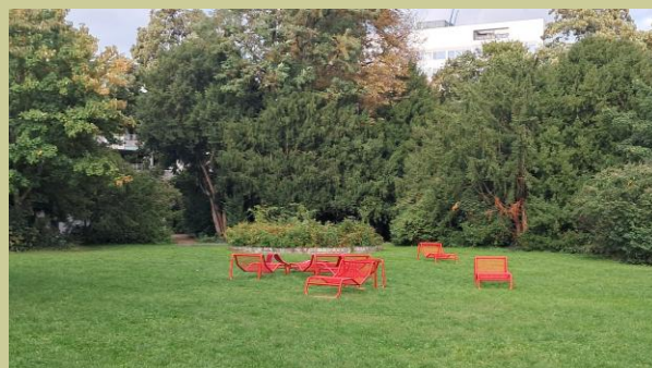
Mobile Liegen im Rosenaupark