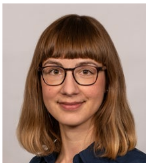
Frau Herbolt Soz.päd. Arbeit, inhaltl. Veranstaltungsarbeit