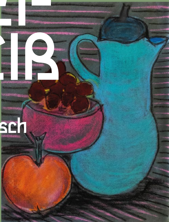
Illustration: Anneliese Raab

Wir legen Wert auf Bio- & Fairtrade-Produkte und arbeiten eng mit regionalen Biohöfen & Partner*innen zusammen. Wenn möglich, sind unsere Zutaten nachhaltig und naturbelassen.