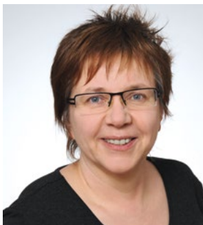
Frau Birkel Verwaltung