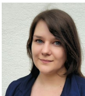
Frau Dörntlein Haus- und Veranstal- tungsmanagement