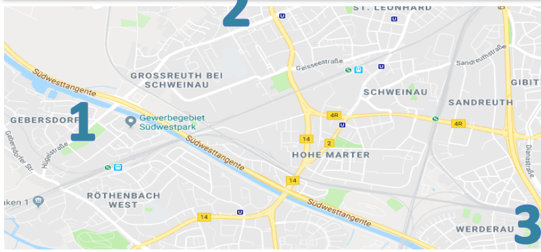
3. Sportpark Süd