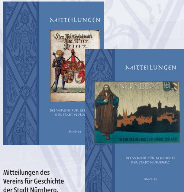
Mitteilungen des Vereins für Geschichte der Stadt Nürnberg.

In den Mitteilungen des Vereins für Geschichte der Stadt Nürnberg (MVGN) erscheinen jährlich Aufsätze aus allen Bereichen der Nürnberger Stadtgeschichte. Etablierte Fachleute sind hier als Autoren ebenso vertreten wie Nachwuchswissenschaftler. Jeder Band dieser renommierten landesgeschichtlichen Zeitschrift enthält zudem einen Besprechungsteil sowie eine Zusammenschau der zur Nürnberger Geschichte neu erschienenen Arbeiten. Mitglieder des Vereins erhalten die Bände als Jahressgabe sowie einen Preisnachlass von 33 % auf ältere Bände. Aber auch andere Titel und ausgewählte Neuerscheinungen können von Vereinsmitgliedern zu exklusiven Subskriptionspreisen erworben werden, wie beispielsweise das „Stadtlexikon Nürnberg“ oder das „Nürnberger Künstlerlexikon“.