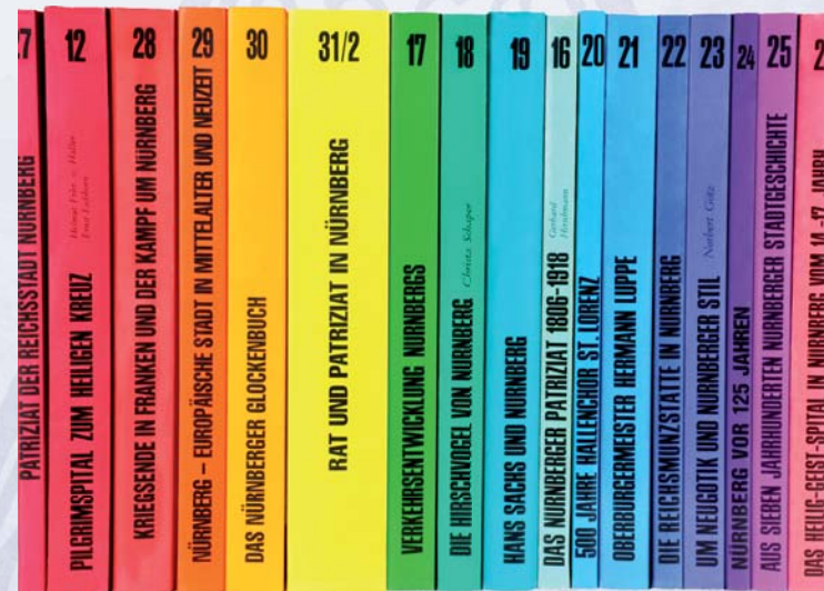
Nürnberger Forschungen. Einzelarbeiten zur Nürnberger Geschichte.

Umfangreichere Monographien und Abhandlungen zu stadtgeschichtlichen Themen werden in der unregelmäßig erscheinenden Reihe der Nürnberger Forschungen publiziert. Hier erhalten Vereinsmitglieder einen Preisnachlass von 33 %. Darüber hinaus regt der Verein konkrete, von ihm mitfinanzierte Forschungsprojekte an. Die mit rund 13.000 Bänden vorzüglich ausgestattete Vereinsbibliothek sowie das Vereinsarchiv können im Stadtarchiv Nürnberg eingesehen werden. Die Anbindung an das Stadtarchiv als dem „Gedächtnis der Stadt“ bietet überdies die Möglichkeit zur quellennahen Forschung vor Ort. Fachwissenschaftler, aber auch Forscher „in eigener Sache“ wie etwa zur Familien- oder Häusergeschichte finden hier ideale Arbeitsbedingungen vor.