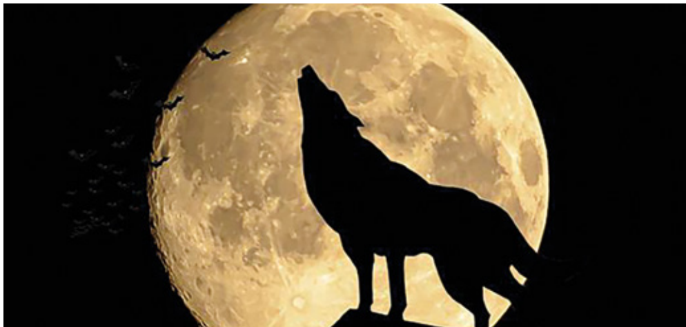
Dass Wölfe den Mond anheulen, ist nur ein Mythos.