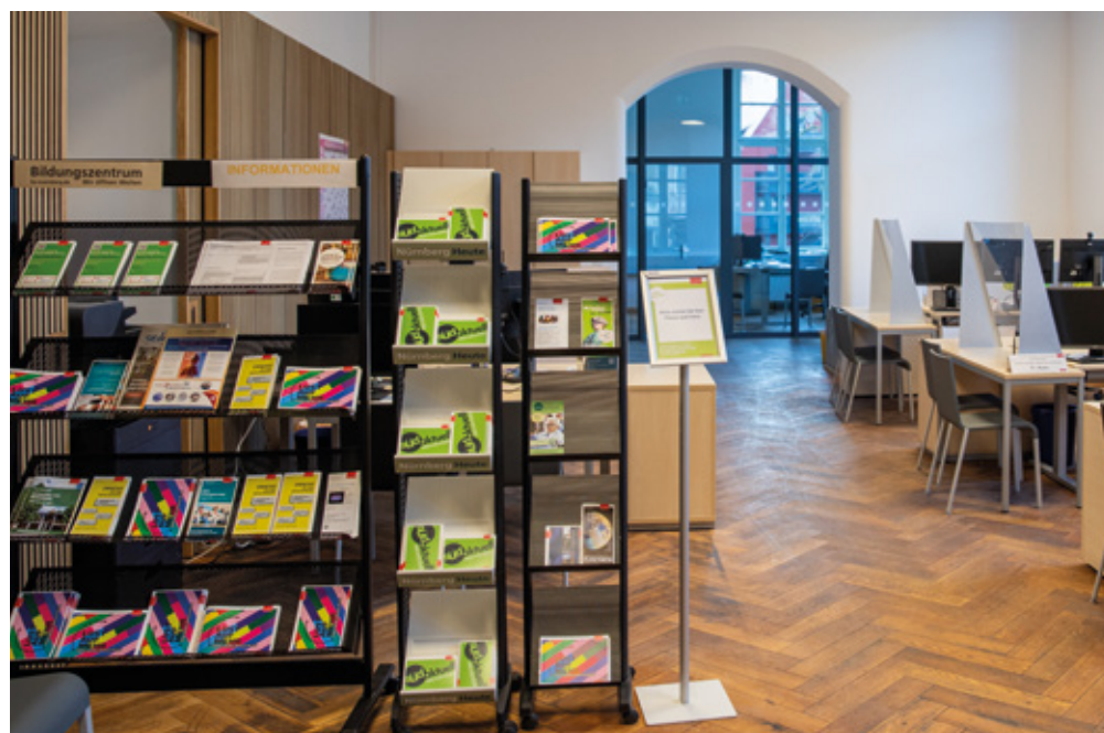
Beratung, Anmeldung, Kursinfo - mit dem Umzug des Servicebüros ist jetzt alles unter einem Dach.