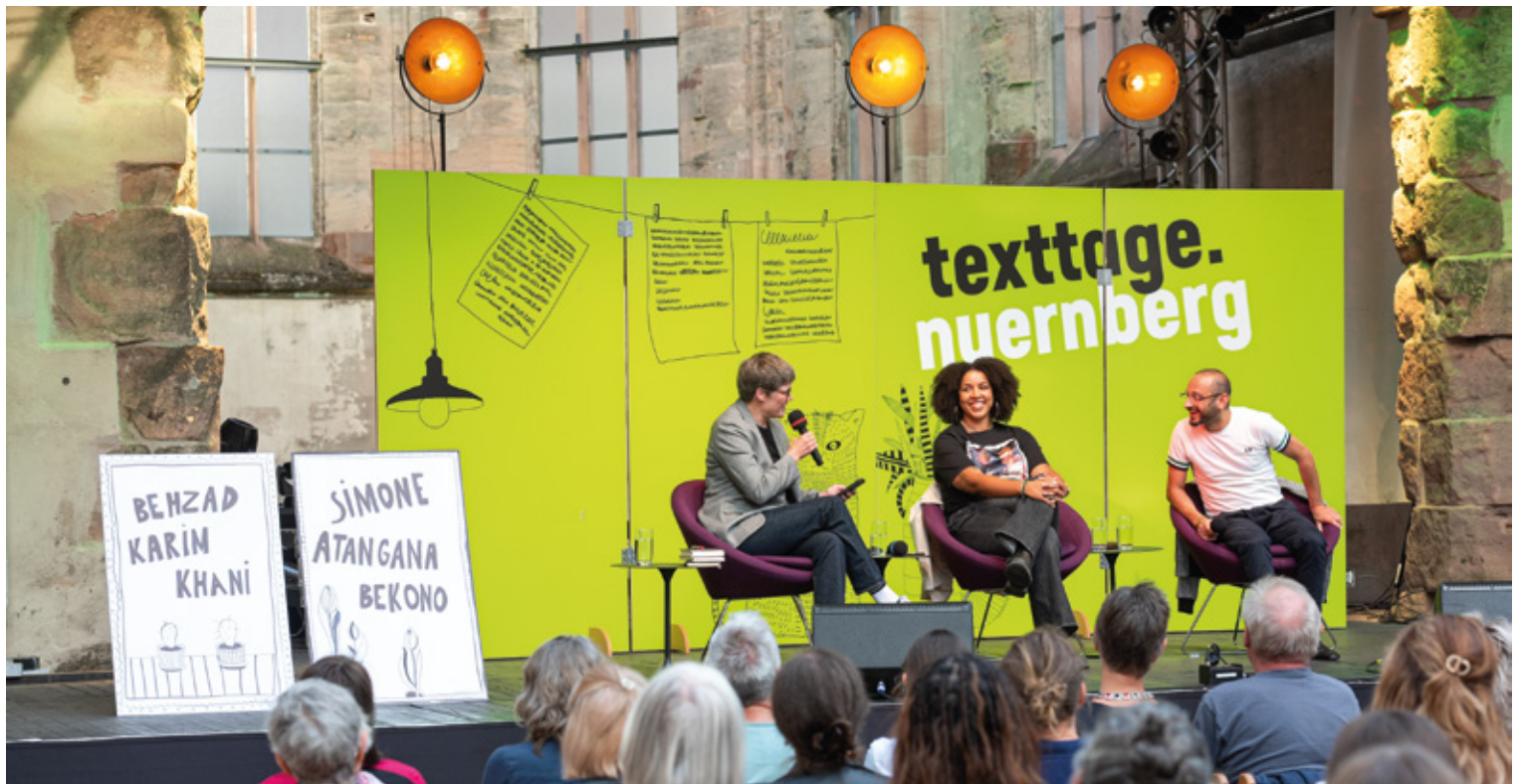
Unterhaltsam und anregend sind die Podiumsdiskussionen während der texttage.nuernberg. Auch in diesem Jahr werden spannende Gäste erwartet.

Tschechien ist Gastland der siebten texttage.nuernberg im Juli