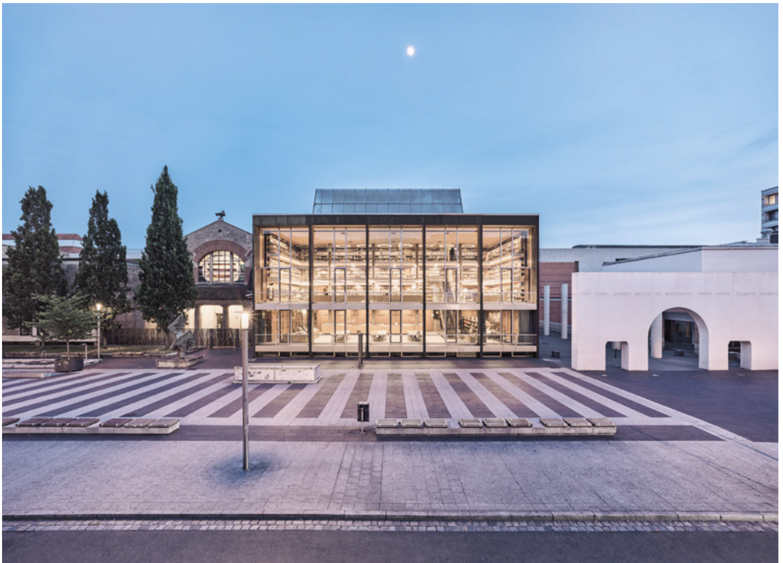
Auf diesem Bild des Fotografen Christian Höhn erstrahlt die Bibliothek des Germanischen Nationalmuseums als heller Lichtpunkt im Mondschein.

Buch präsentiert faszinierende Fotos von Bücherorten