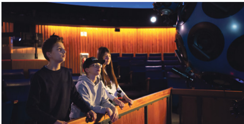
Dass Kinder für Naturwissenschaften zu begeistern sind, zeigt der Erfolg des Planetariums.

Bildungscampus legt viel Wert auf Naturwissenschaften und Technik