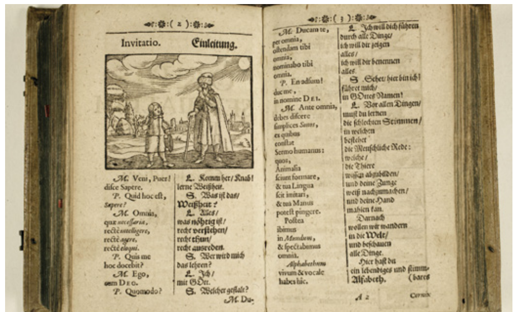
Erstausgabe des von Birken übersetzten und von Johann Amos Comenius verfassten Buches.