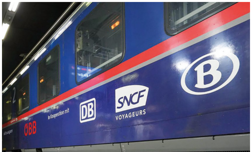
Gut vorbereitet mit den Sprachkursen, reist es sich leichter durch Frankreich und Italien.