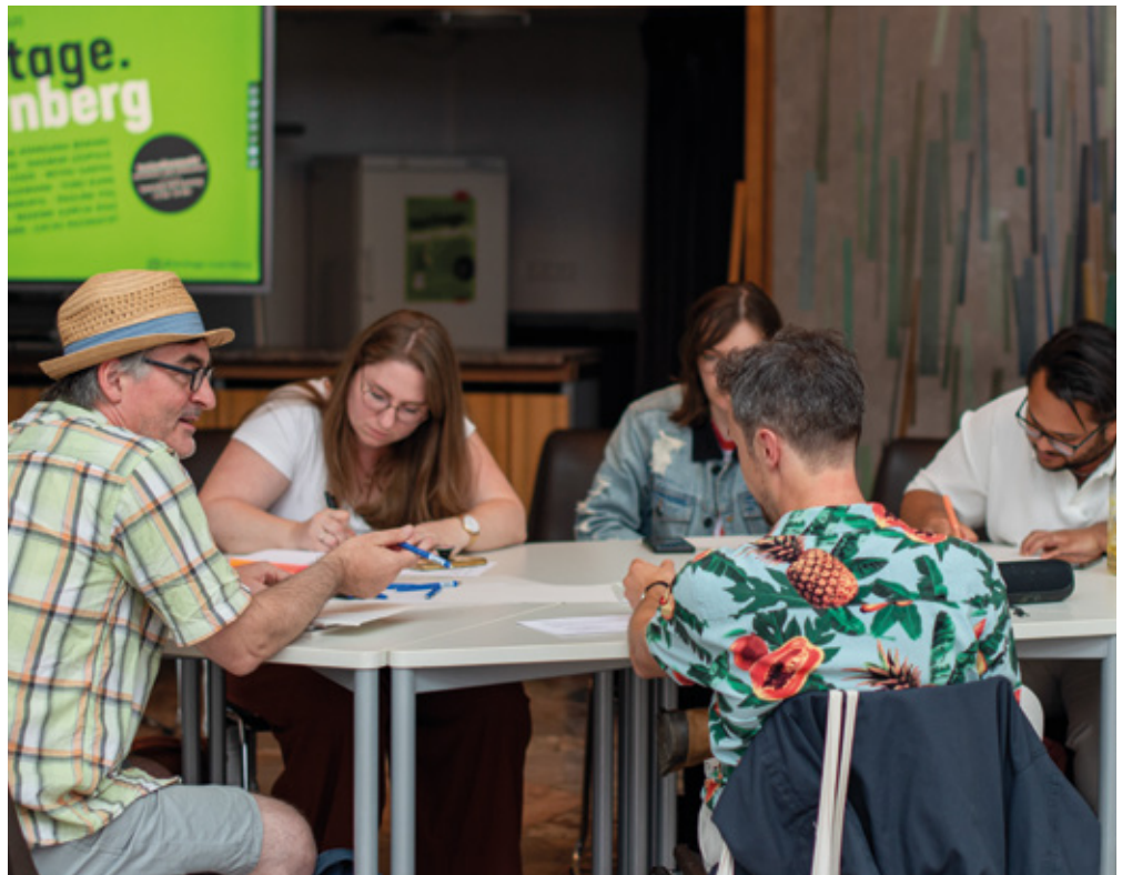
Der Austausch und das gemeinsame Schreiben zählen zu den Besonderheiten des Festivals.

Neben den Schreibworkshops machen alle geladenen Autorinnen und Autoren eine rund einstündige Lesung. Die allerdings läuft ein wenig anders ab als üblich, denn auch