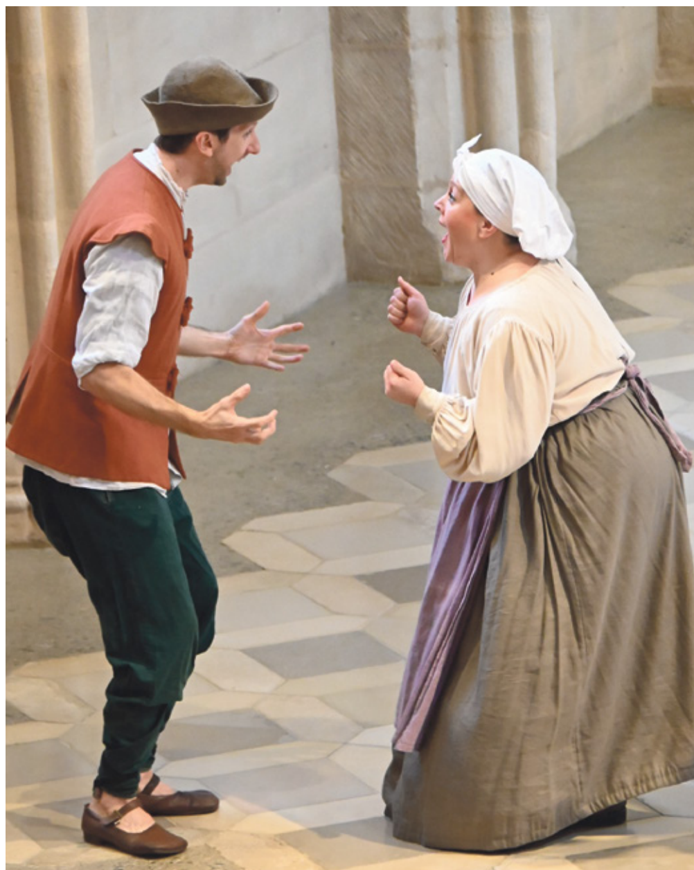
Mit großer Spielfreude führt das Ensemble die Stücke von Hans Sachs auf.