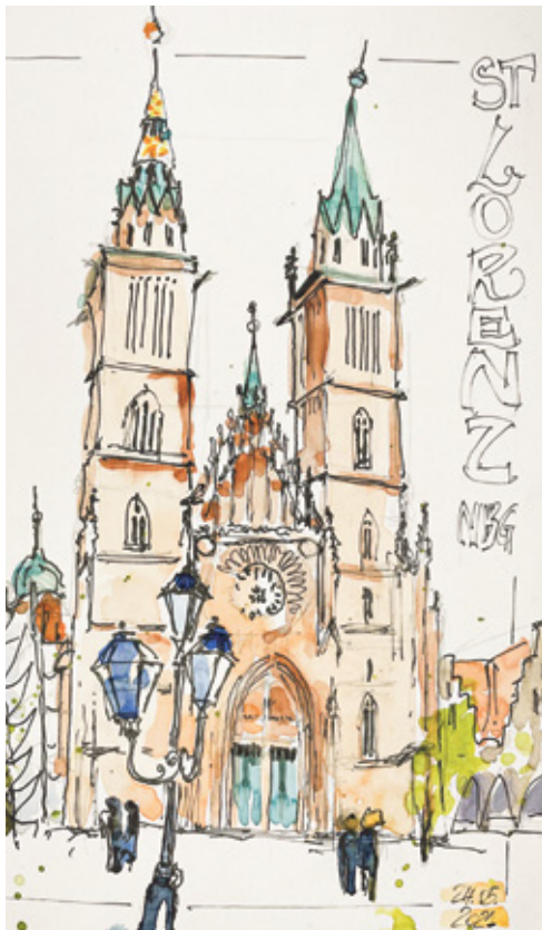
Die Lorenzkirche ist ein beliebtes Motiv.