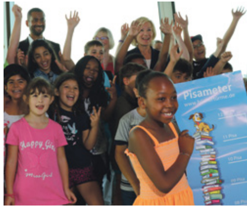
Mit Büchern Türme zu bauen, machte allen an der Aktion Beteiligten Spaß.

Die Kongresshalle Nürnberg ist in erster Linie ein Produktionsstandort. Das Staatstheater Nürnberg ist dort angesiedelt, Ermöglicheräume für Kunst und Kultur werden geschaffen. Der Standort lebt von den Freien Szenen und wird auch internationale Aufmerksamkeit auf sich ziehen.