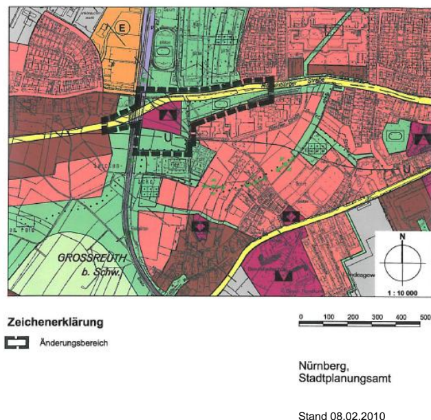
Abb. 1: Änderungsbereich, geplante Darstellungen

Die Flächenanteile der dargestellten Flächen in Hektar bzw. Prozent an der Gesamtfläche und detailliertere Aussagen zu den Zielen des Bauleitplanes sind der Planbegründung zu entnehmen.