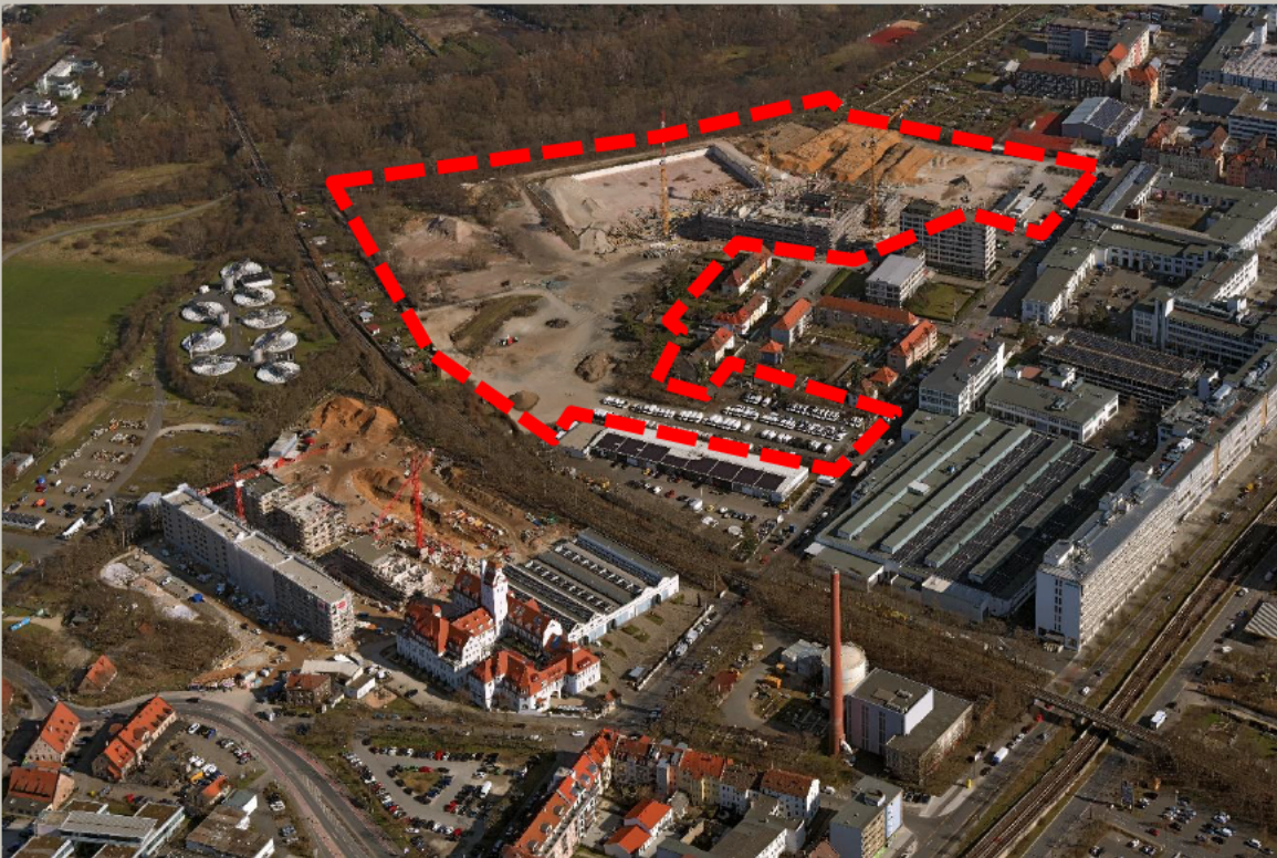
Luftbild Nürnberg Hajo Dietz