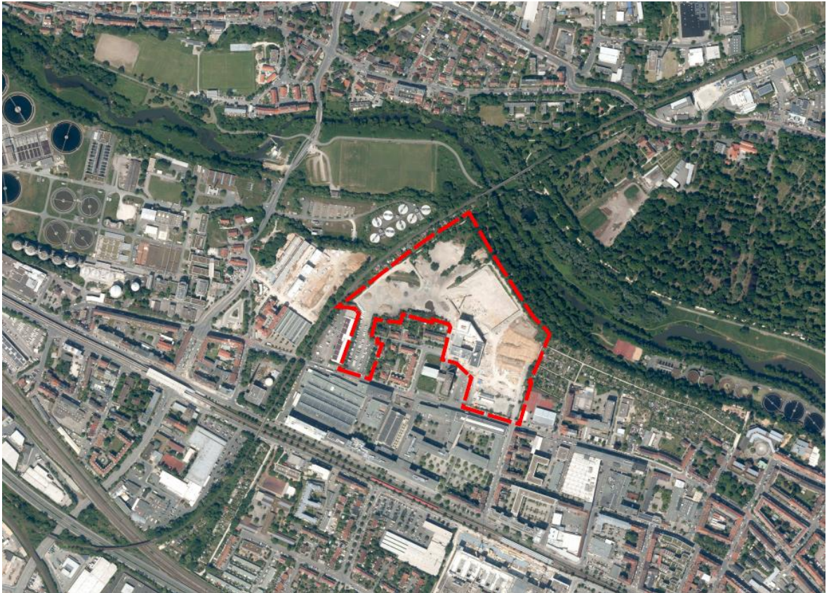
Abbildung 1: Änderungsbereich der 29. Änderung des FNP; ohne Maßstab