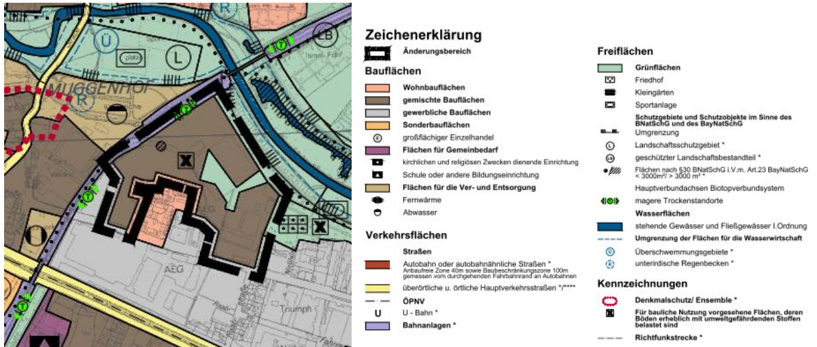
Abbildung 3: 29. Änderung FNP im Bereich nördlich der Muggenhofer Straße, Ausschnitt Änderungsbereich mit Umgebung; ohne Maßstab,

Geplant ist die Darstellung von gemischten Bauflächen, aus denen gemischt genutzte Gebiete gem. § 6 ff BauNVO entwickelt werden können, sowie einer Grünfläche. Der parallel im Verfahren befindliche Bebauungsplan Nr. 4543 A sieht die Festsetzung eines urbanen Gebietes (MU) gem. § 6a BauNVO und einer zentralen öffentlichen Grünfläche vor. Weitere geplante Grünflächen werden aufgrund der Generalisierung von Plandarstellungen (Schwelle 3.000 m 2 ) nicht im FNP dargestellt.