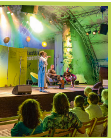
Lesung mit Livemusik.