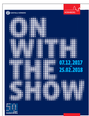
Gestaltung: Martin Kühle

Die Stadt Nürnberg war 2017 erstmals bei der Verbrauchermesse Consumenta mit einem großen Stand vertreten. Vom 28. Oktober bis 5. November präsentierten viele kommunale Einrichtungen neun Tage lang in der Halle 1 des Messezentrums ihre vielfältigen Angebote. Ein täglich wechselndes Programm auf einer Aktionsfläche, eine außergewöhnliche Foto-Ausstellung und ein Gewinnspiel mit attraktiven Preisen sorgten für viele Begegnungen der Besucherinnen und Besucher mit der Stadt Nürnberg. Die Consumenta verzeichnete mit 180 000 Gästen diesmal einen besonders großen Zuspruch.