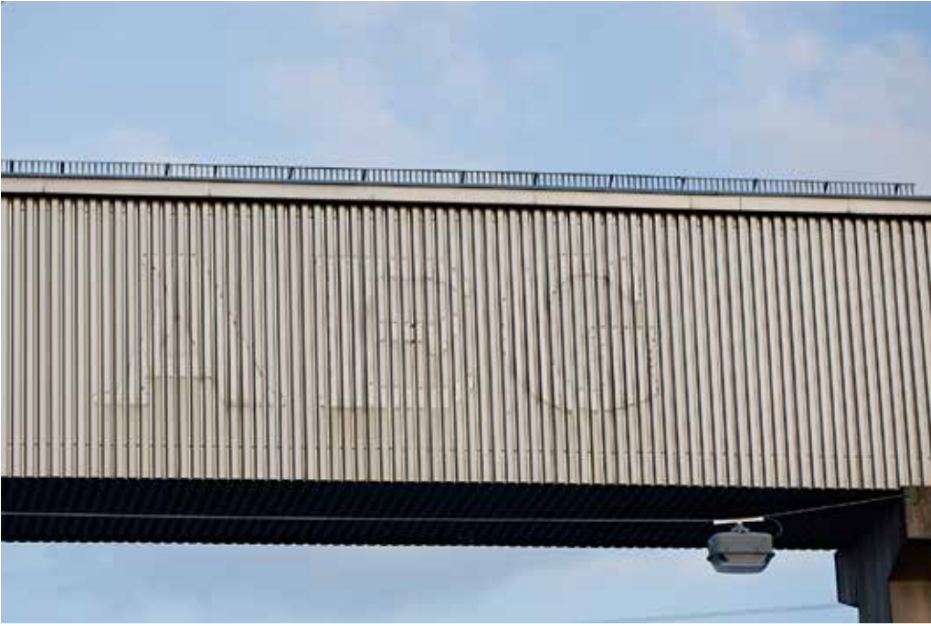
36