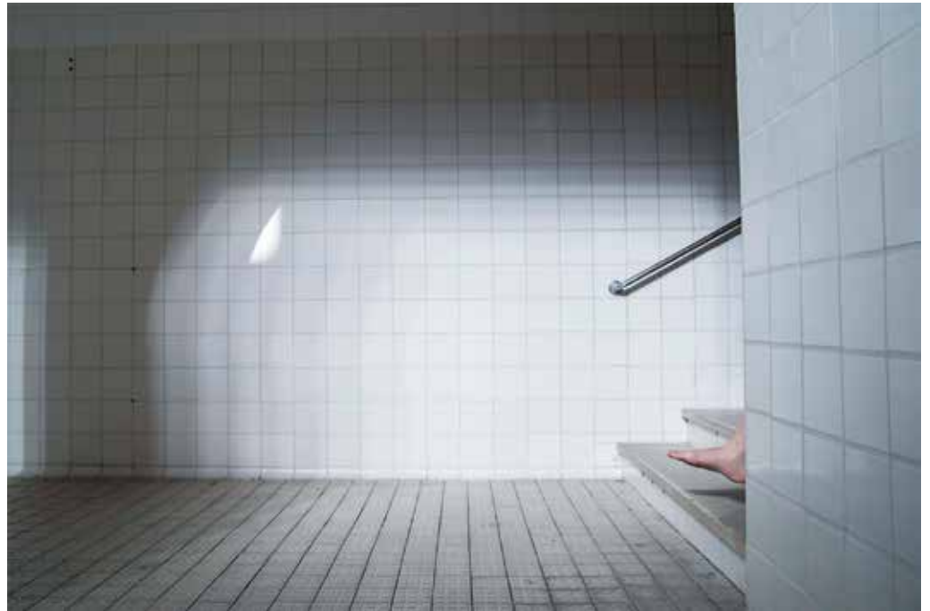
39 | Foto: Masha Tuler