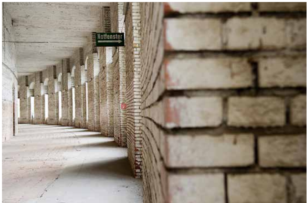
32 | Foto: Jutta Missbach