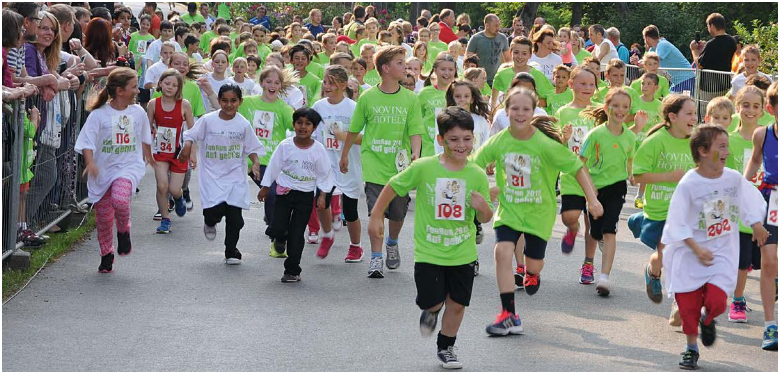
Beim „FunRun“ 2015 waren auch 375 Kinder mit viel Spaß dabei. Der Veranstalter überwies der Bürgerstiftung 2 000 Euro für das jährliche Schüler-Sommercamp.