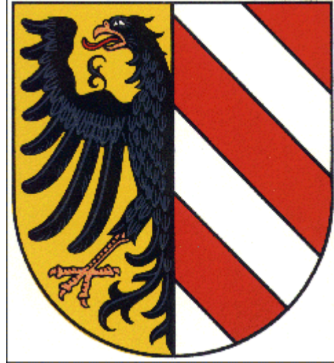
Das Kleine Stadtwappen