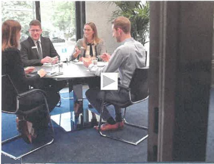
Film ab: Die Bank für Kirche und Diakonie in 210 Sekunden www.KD-Bank.de/Film